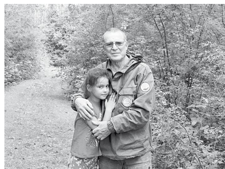
«Самый счастливый день» Дедушкино сокровище Ты - сокровище мое, Дорогая внучка! Сразу к сердцу ты нашла Свой волшебный ключик. Понимаю я тебя Прямо с полуслова. Будь красива и умна, Счастлива, здорова!