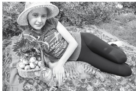
«Самый счастливый день» Свою внучку обожаю И люблюсь ей с рождения! Получаю много новых И приятных впечатлений! Ах, внученька! Принцесса! Красавица моя! Как широко распахнуты Невинные глаза! Ты - нежный лучик света, Ты яркая, как лето! Добром, любовью, счастьем Пусть будет жизнь согрета!