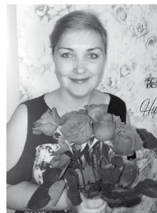
«Самый счастливый день» Просыпаясь, улыбаюсь солнцу, небу и земле! Жизнь прекрасна! Жизнь чудесна! Люди, улыбайтесь мне!

«Улыбка на миллион» Мой внук Арсений.