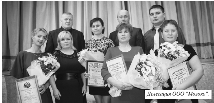
Делегация ООО "Молоко".