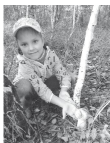
"Само очарование"

вой с дочкой Богданой, которой нынче исполнилось пять лет, набрало к тому же наибольшее количество «лайков» в соцсетях. Мама с дочкой – «Само очарование»!