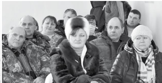
Участники схода в Рязовском сельском поселении.

ны говядины. Вырученные от реализации продукции ЛПХ средства люди используют на развитие своих подворий, приобретение животных, благоустройство домов.