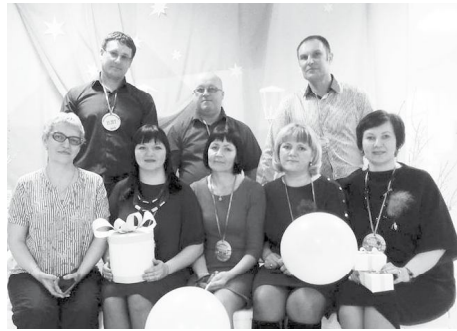
Участники вечера встречи.

Встреча выпускников - это радостное мероприятие. Оно дает возможность увидеться и поговорить со своими одноклассниками, учителями, вспомнить чудесные школьные годы.