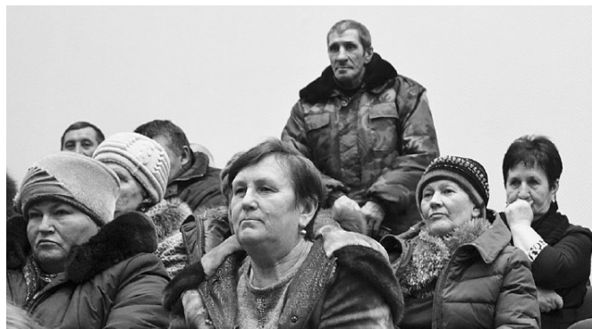
Идет сход граждан в Пеганово.

о расходах и доходах местного бюджета, ознакомила собравшихся с краткими итогами социально-экономического состояния территории за прошедший год.