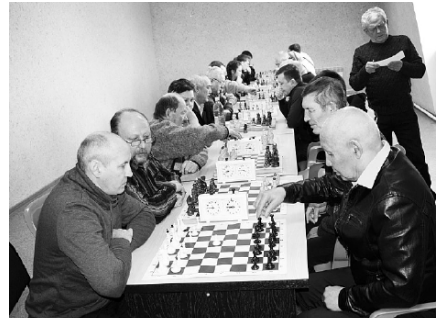
За шахматным столом встретились интеллектуалы.

ченности, развивает мышление. Научиться играть в шахматы никогда не поздно, здесь нет возрастных ограничений.