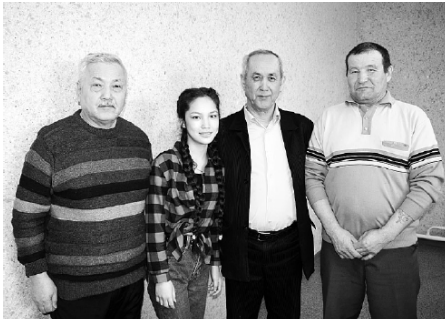
Команда шахматистов (с. Зарослово).