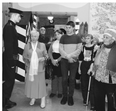
Экскурсия по музею.

сердцах память об отцах, не вернувшихся с фронта. Это не только память семьи - это историческая память обо всей Великой Отечественной войне, о подвиге нашего героического многострадального народа. Подтверждение тому - стенды в комнате, где находится штаб организации. С фотографий на нас смотрят защитники Родины, которые, я уверена, гордились бы своими детьми, хранящими память о них.