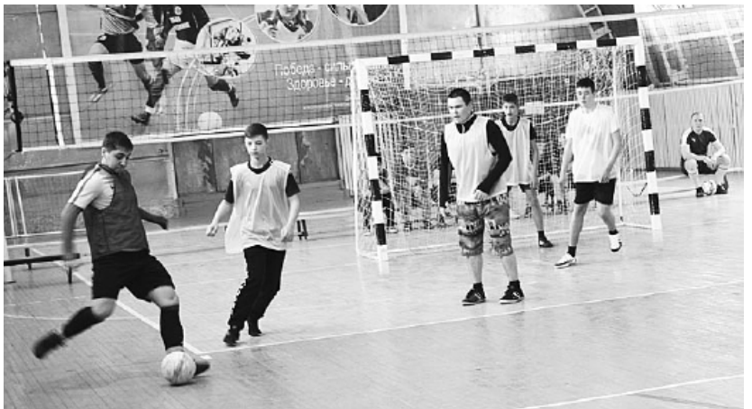
Упорная борьба за выход в финал. / Фото Сергея Чекунова.