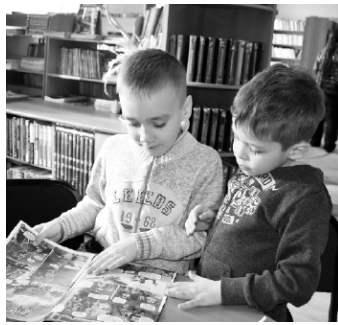
В гостях в детской библиотеке - воспитанники группы «Колокольчики» детского сада «Малышок».