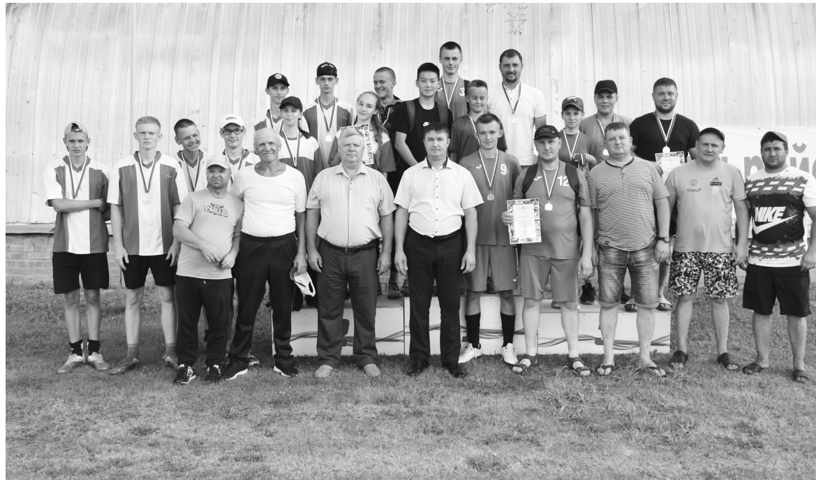
Участники и болельщики командных соревнований по лапте

- Мы рады приветствовать всех, кто посвятил свою жизнь спорту, кто с честью представляет Бердюжский район на спортивных соревнованиях различного уровня и возвращается домой с победой. Желаю всем участникам удачи и ярких