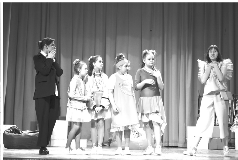
Постановки студии «Овация» - яркие и интересные