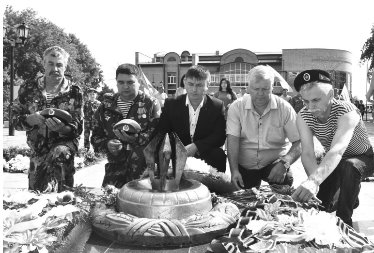
Цветы к мемориалу – дань памяти и уважения