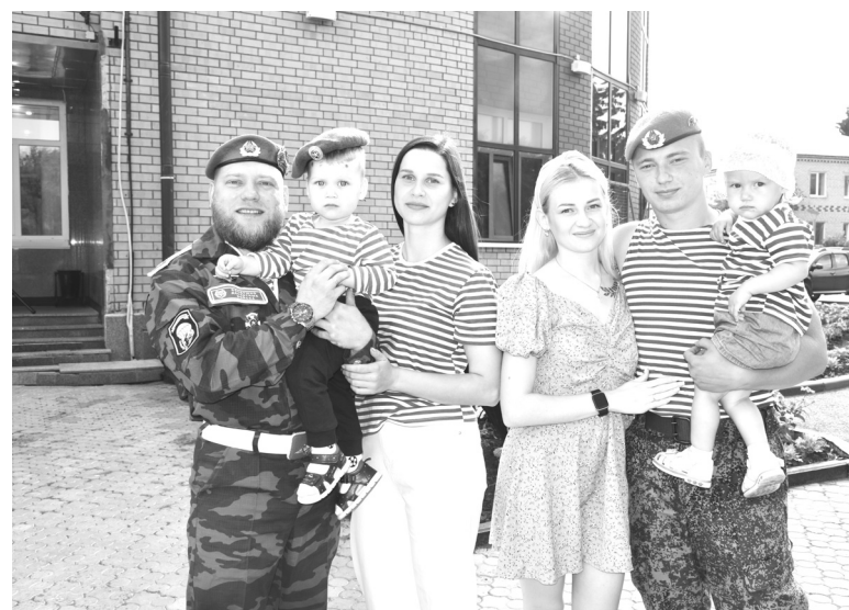
День ВДВ – праздник, который десантники отмечают со своими семьями