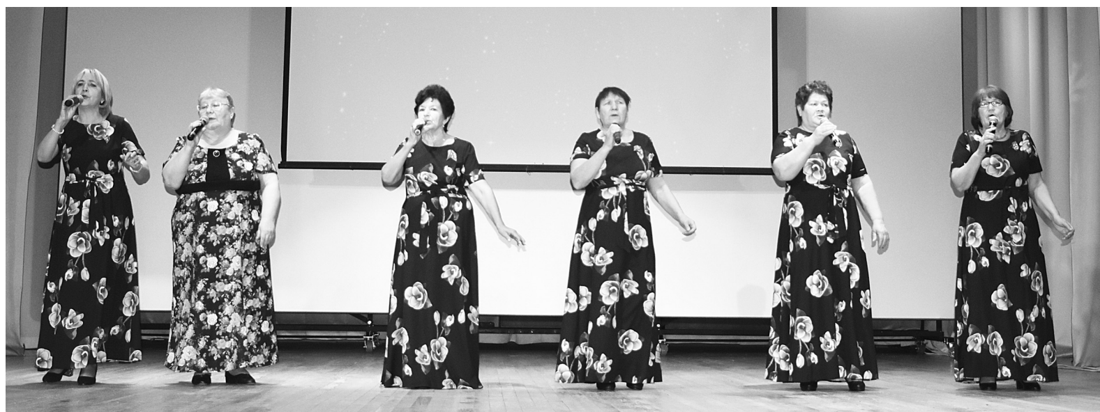
Своим талантом радует всех ансамбль «Ивушка» из Истошино