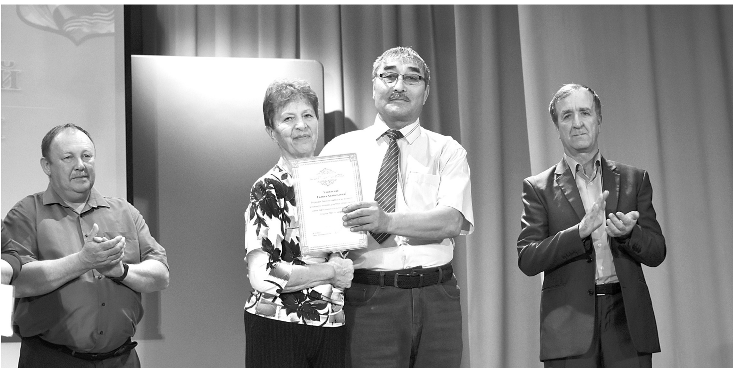
Главы сельских поселений отметили своих ветеранов за активность и неиссякаемую энергию и доброту