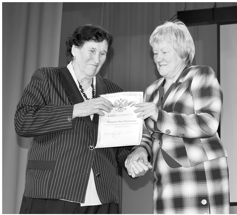
Награды, цветы и поздравления - обязательные атрибуты праздника