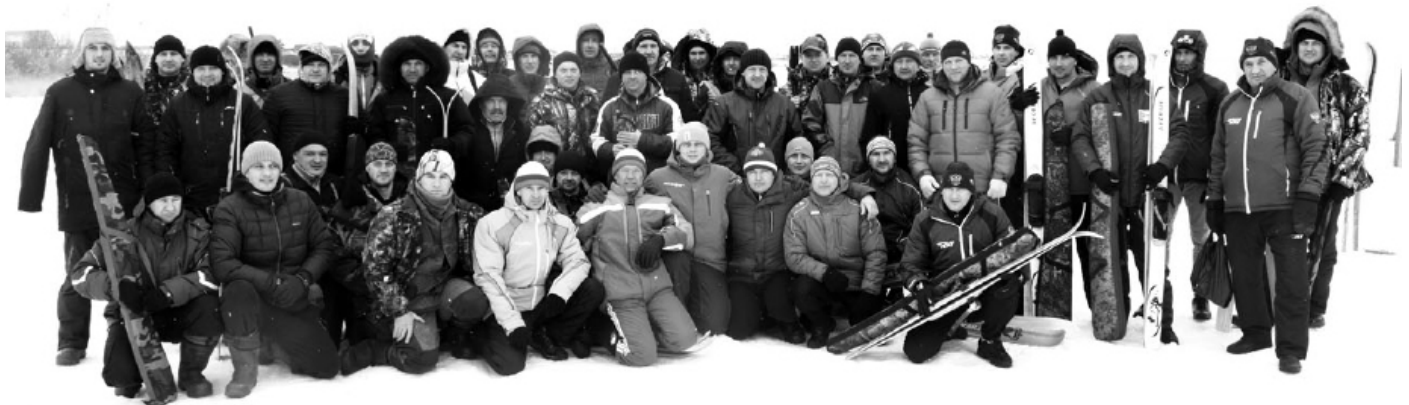
Участники турнира по охотничьему биатлону.