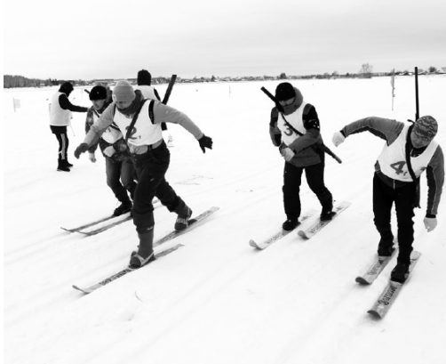
На лыжной трассе и на огневом рубеже.

-Предугадать победителя невозможно, из-за сильного ветра тарелочки, по которым нужно стрелять, относят