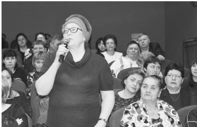
Участники схода граждан.