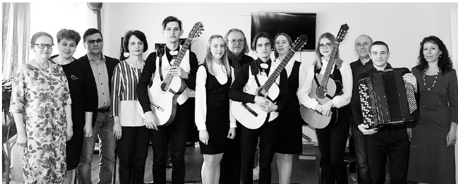
В гостях у музыкальной школы – преподаватели и студенты Тобольского многопрофильного техникума имени А.А.Алябьева.

В этот день в музыкальной школе прошел не только концерт, преподаватели техникума провели для ребят мастер-классы по классу ба-