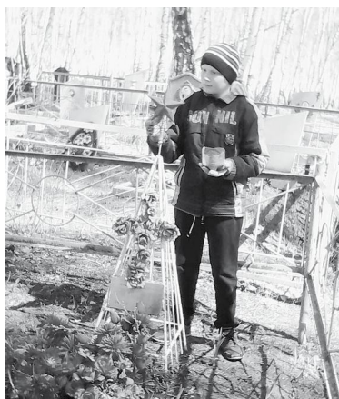
Они никогда не бросят в беде и всегда придут на помощь.

–Герои Великой Отечественной войны настолько близки каждому из нас, что хочется верить: мы никогда не сможем забыть подвиги наших дедов и прадедов. Каждая семья хранит немало историй из жизни, которые с трепетом, а часто и со слезами на глазах передаются из уст в уста. Но время идет, уходит из жизни участники войны, их дети, внуки разезжаются по разным уголкам страны. За могилами участ-