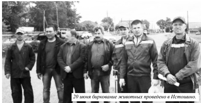
20 июня биркование животных проведено в Истошино.

Во-вторых. Остается очень напряженной ситуация по африканской чуме