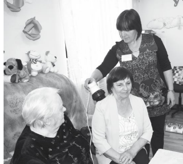
Для улучшения кровообращения можно воспользоваться специальным массажером.