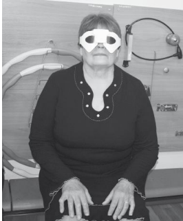
Массажные очки для снятия глазного напряжения.

В Бердюжском районе более ста человек работают в сфере социальной защиты населения. На сегодняшний день социальная служба предоставляет 84 вида мер соцподдержки. На надомном обслуживании находятся 60 граждан пожилого возраста и инвалидов. Одним из главных направлений деятельности социальной защиты является работа с детьми.