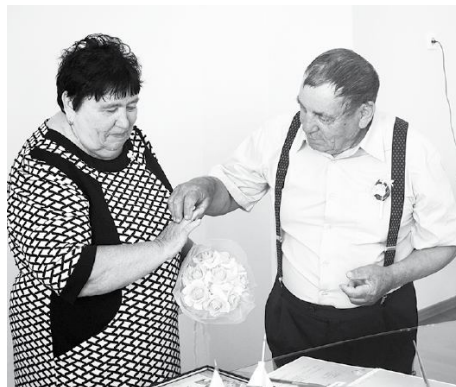
Золотые юбиляры Рогачевы обменялись обручальными кольцами.

Нина Ивановна работала весовщицей в совхозе «Глубоковский», была заведующей клубом и столовой, трудилась продавцом в магазине в своей родной деревне Чес-