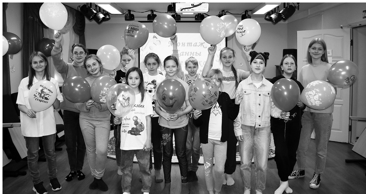
Лето в лагере проходит весело и увлекательно