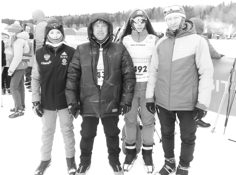
В Югорском марафоне участвуют юные и опытные бердюжские спортсмены