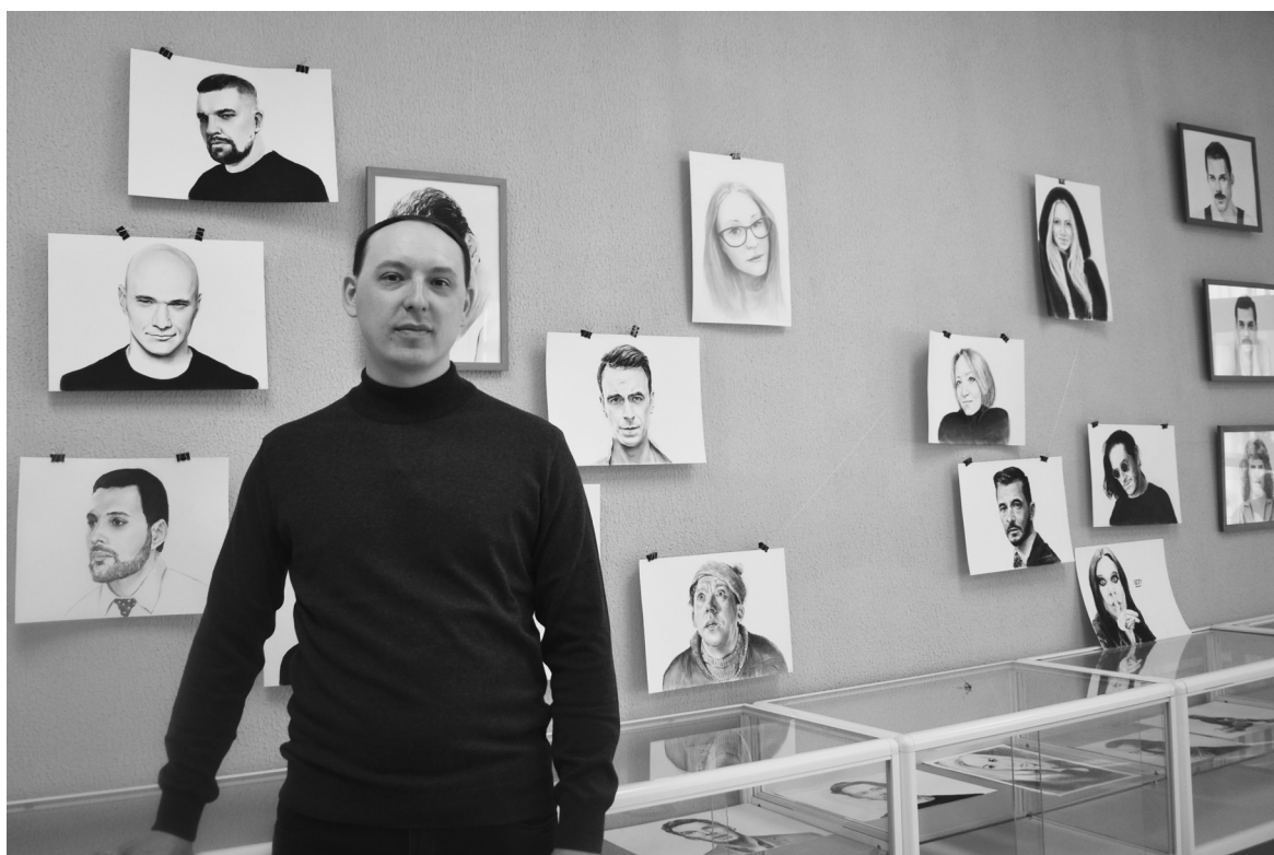
В экспозиции представлены портреты известных музыкантов и актеров