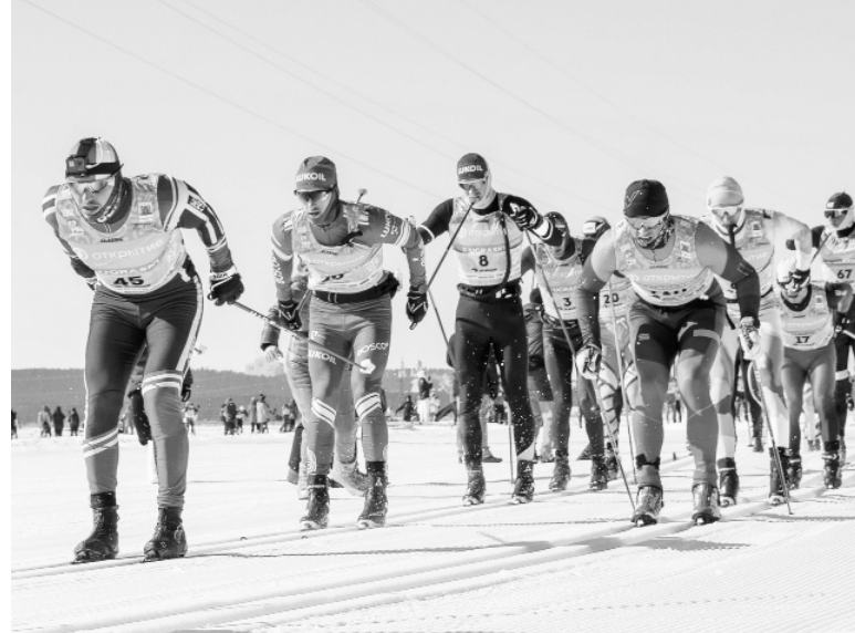
На дистанцию вышли тысячи участников, в их числе - знаменитые лыжники и биатлонисты