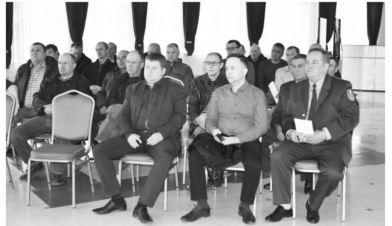
Охотники могли обратиться с вопросами и обозначить волнующие их проблемы