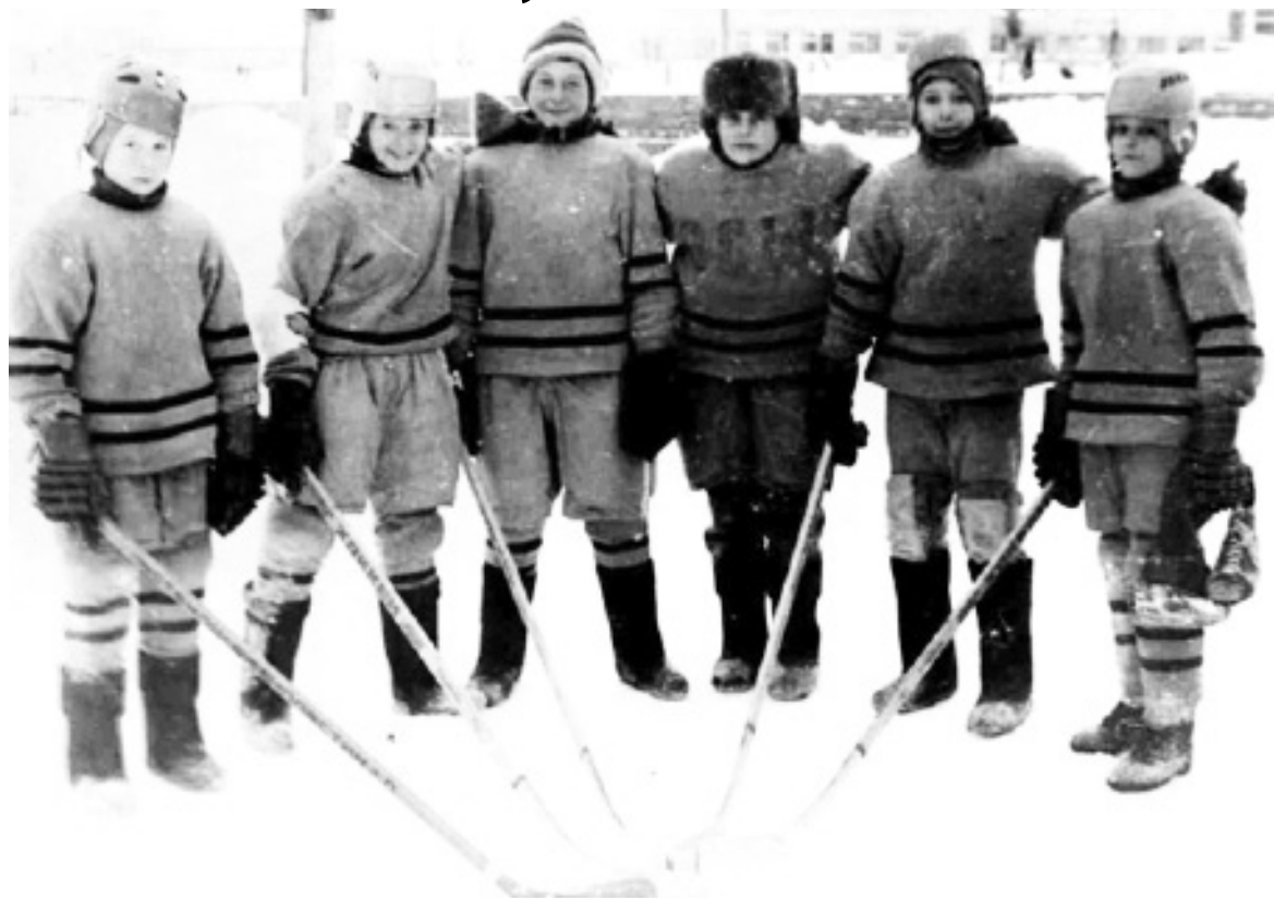
Великолепная «пятерка» и вратарь - победители «Золотой шайбы» из Окуневской средней школы

Родоначальником Русского хоккея (хоккея с мячом) в районе принято считать село Уктуз. Там впервые был оборудован каток на озере. На этом катке размечались беговые дорожки для проведения конькобежных соревнований. Поле для хоккея с мячом было 100 на 70 метров. Это были 1960 - 1966 годы.