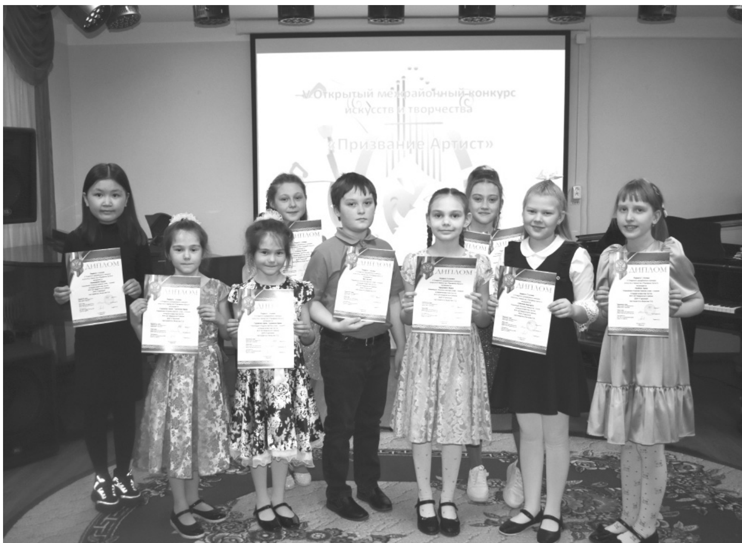
Лауреаты младшей возрастной категории – воспитанники театрального и музыкального отделений