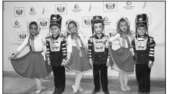
Ребятки-котятки на конкурсе были...