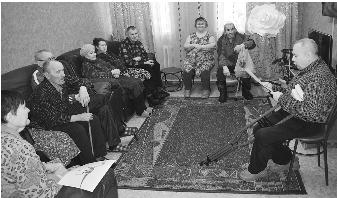
В доме-интернате часто проходят тематические мероприятия и беседы