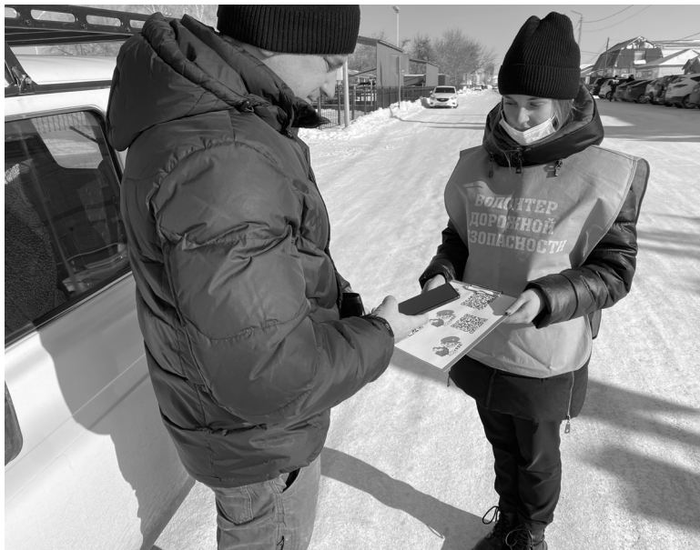
Все автолюбители в этот день получили памятные сувениры

Автолюбителям, которые допускали ошибки в ответах, организаторы мероприятия разъяснили правильность решения. А тем, кто уверенно и правильно ответил на все