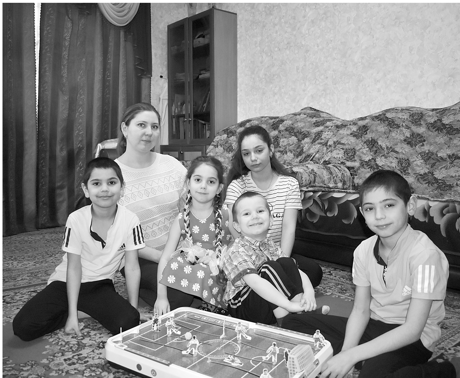
Собраться вместе вечером, чтобы поиграть и поговорить, стало уже семейной традицией. Ребята спешат сыграть матч и рассказать маме, как прошел их день