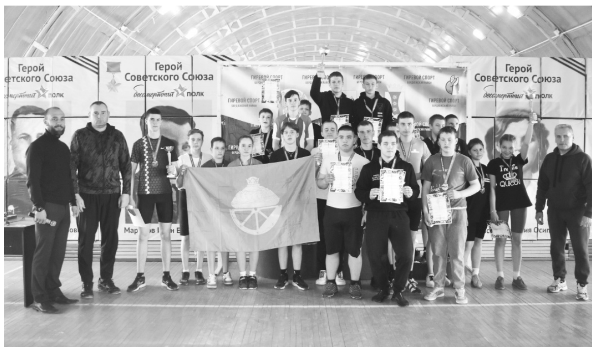
Спортивный день стал удачным для всех команд: никто не остался без медалей и дипломов