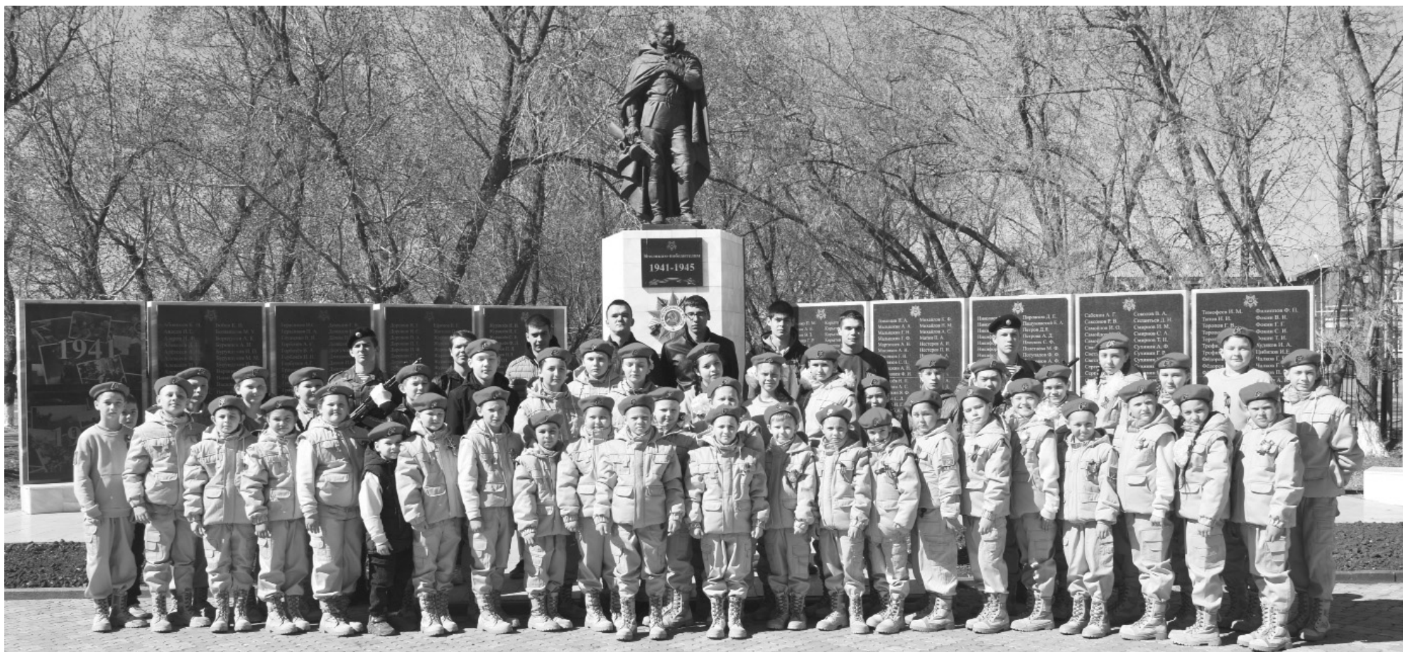
С призывниками будущие защитники Отечества – ребята из юнармейского отряда «Орленок» и воспитанники кадетского класса «Стрижи»