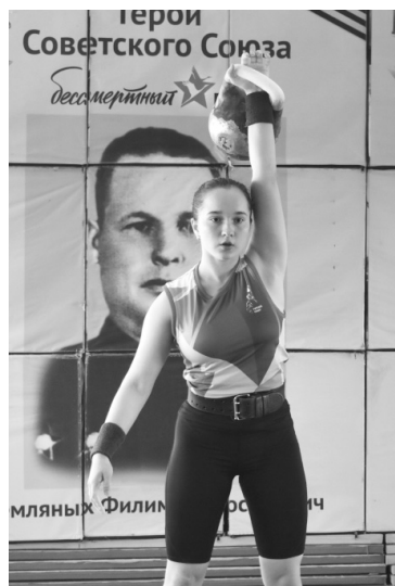
На помостах ребята боролись не только с соперниками, но и с самим собой, проявляя терпение и силу воли к победе