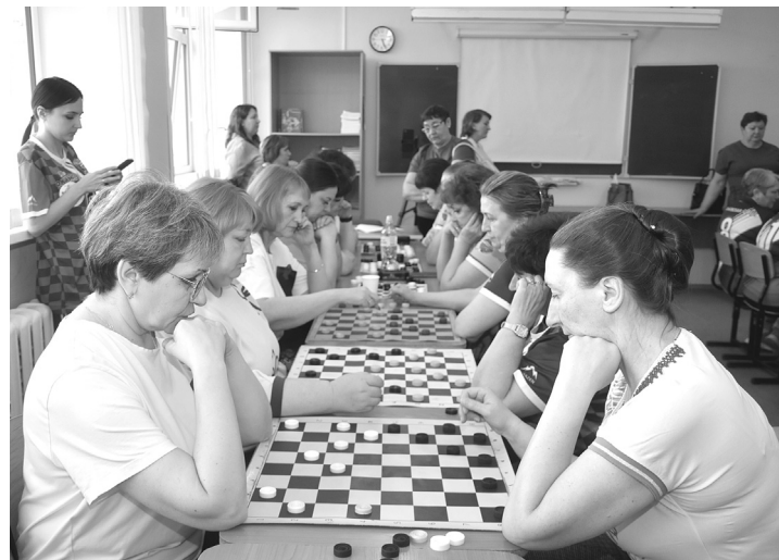
Соревнования спартакиады прошли по нескольким видам: волейболу, стрельбе, шашкам и настольному теннису