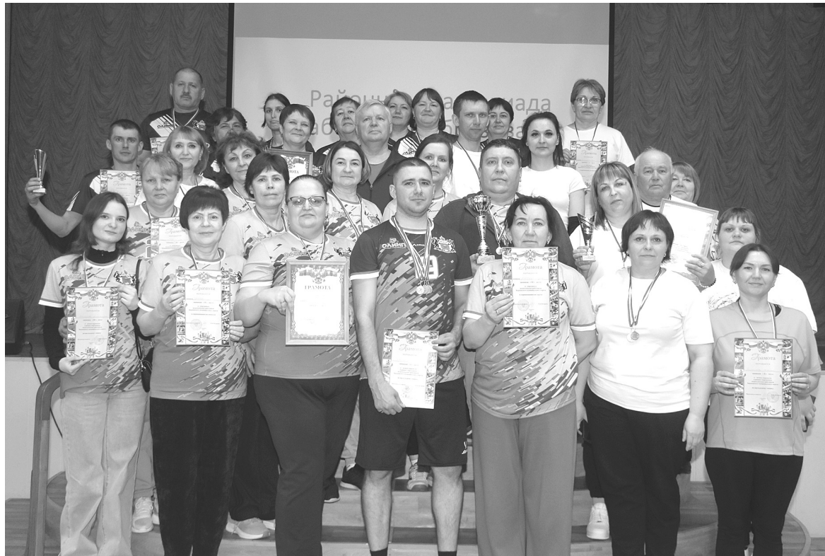
Команды и призеры в отдельных видах спорта отмечены грамотами и медалями