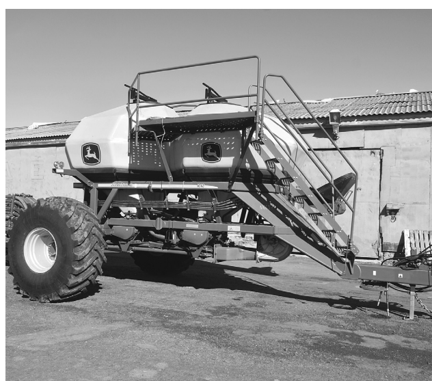
Ремонт техники завершается в мастерской и на открытой площадке