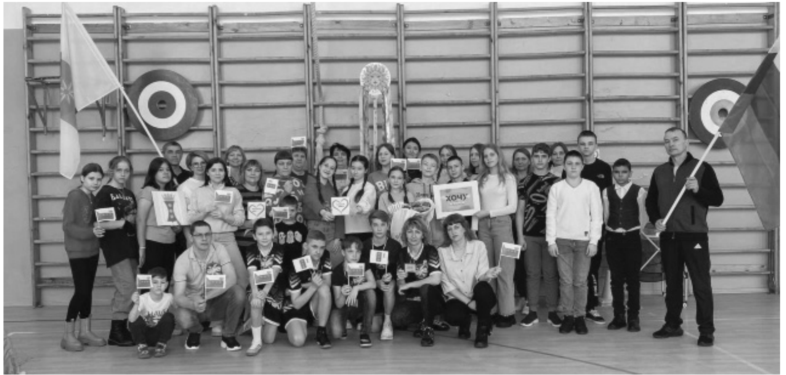
Спортивные соревнования и флешмобы объединяют ребят и их родителей, учителей школы

- Нет, задачи не меняются. Пропаганда здорового образа жизни стояла и стоит во главе угла. Я еще и руководитель кабинета профилактики употребления психоактивных веществ, поэтому тут деятельность пересекается. Волонтеры делают то, что в их силах в данном направлении: распространяют листовки с информацией о вреде употребления психоактивных веществ, проводят мероприятия, направленные на пропаганду ЗОЖ и отказ от вредных привычек. В этом году