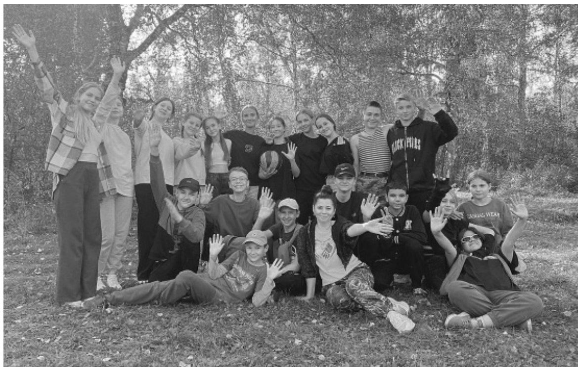
Добрые традиции волонтеров - прогулки и соревнования на свежем воздухе

Фото из архива волонтерского отряда Бердюжской школы #PROдобро