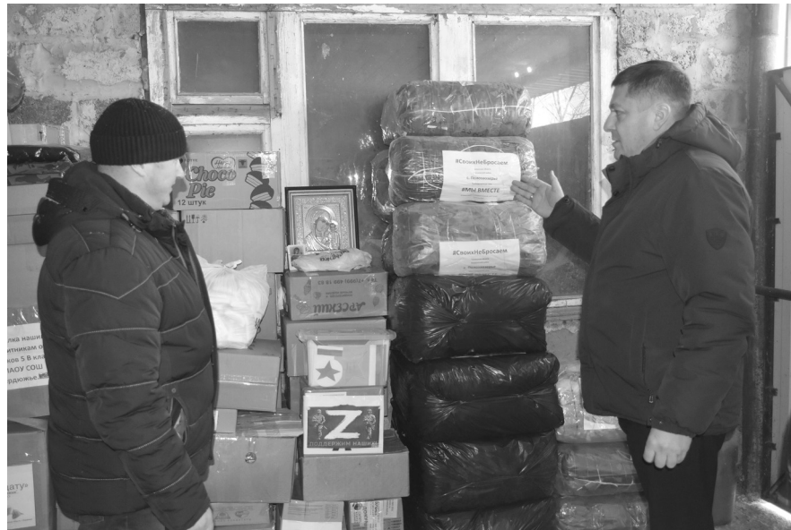
В Донбасс будет доставлено самое необходимое для солдат: сети, сухие души и сухие супы, посылки с продуктами питания