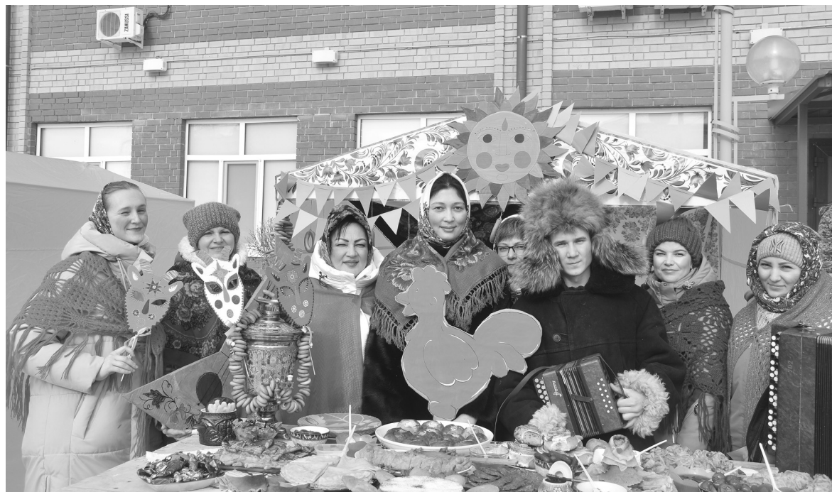
Коллектив Бердюжской районной больницы удивил не только вкусными угощениями, но и творчеством – веселыми песнями и частушками

Не пустовали в этот день и блинные ряды, хозяйки которых пекли блины и угощали ими всех желающих. Тут можно было полакомиться пирогами