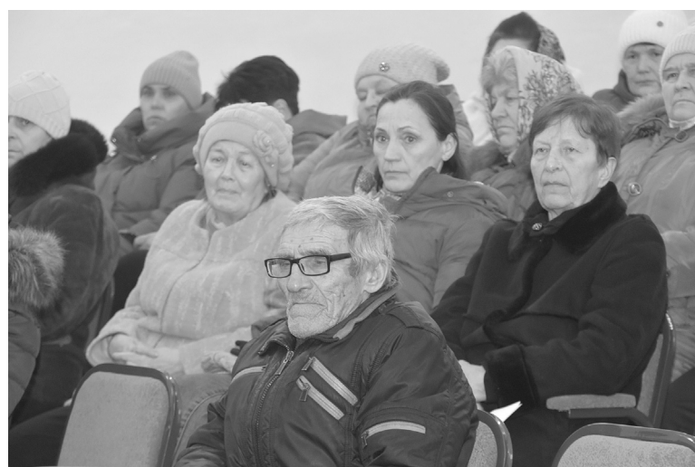
Жителей поселения волнуют вопросы благоустройства и здравоохранения