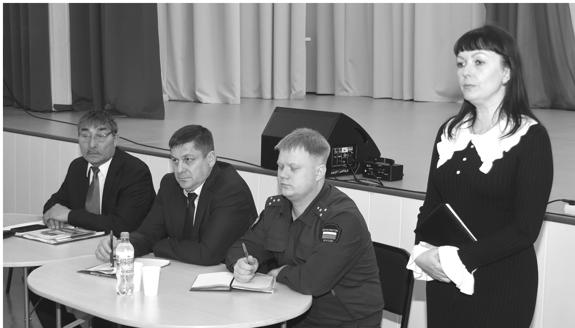
На вопросы жителей в ходе собрания ответил глава округа, руководители учреждений

– Благодарны нашим педагогам и ученикам за совместную