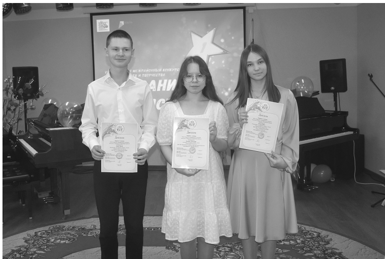
Воспитанники из Голышманово и Армизонского стали лауреатами конкурса

- Мы благодарим воспитанников школ искусств, которые сегодня справились с волнением и хорошо выступили, родителей - за поддержку и терпение,