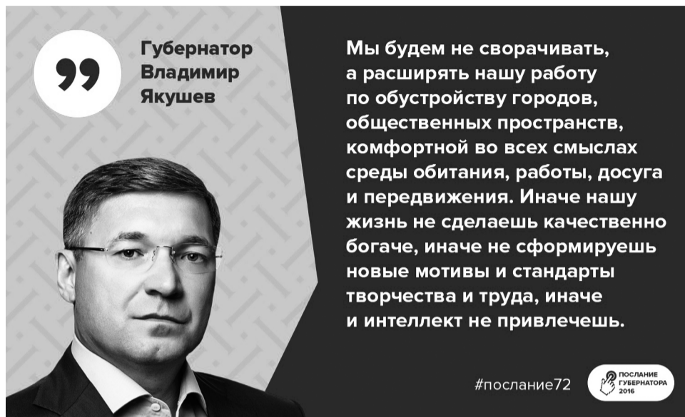
Губернатор Владимир Якушев

Я много думал об этом и, кажется, нашел ответ. Потому что все это время наша политика была не только продуманной, рациональной, стратегически выверенной. Но прежде всего потому, что наша политика была честной.