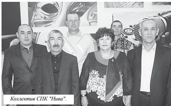
Коллектив СПК "Нива".