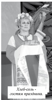
Хлеб-соль - гостям праздника.