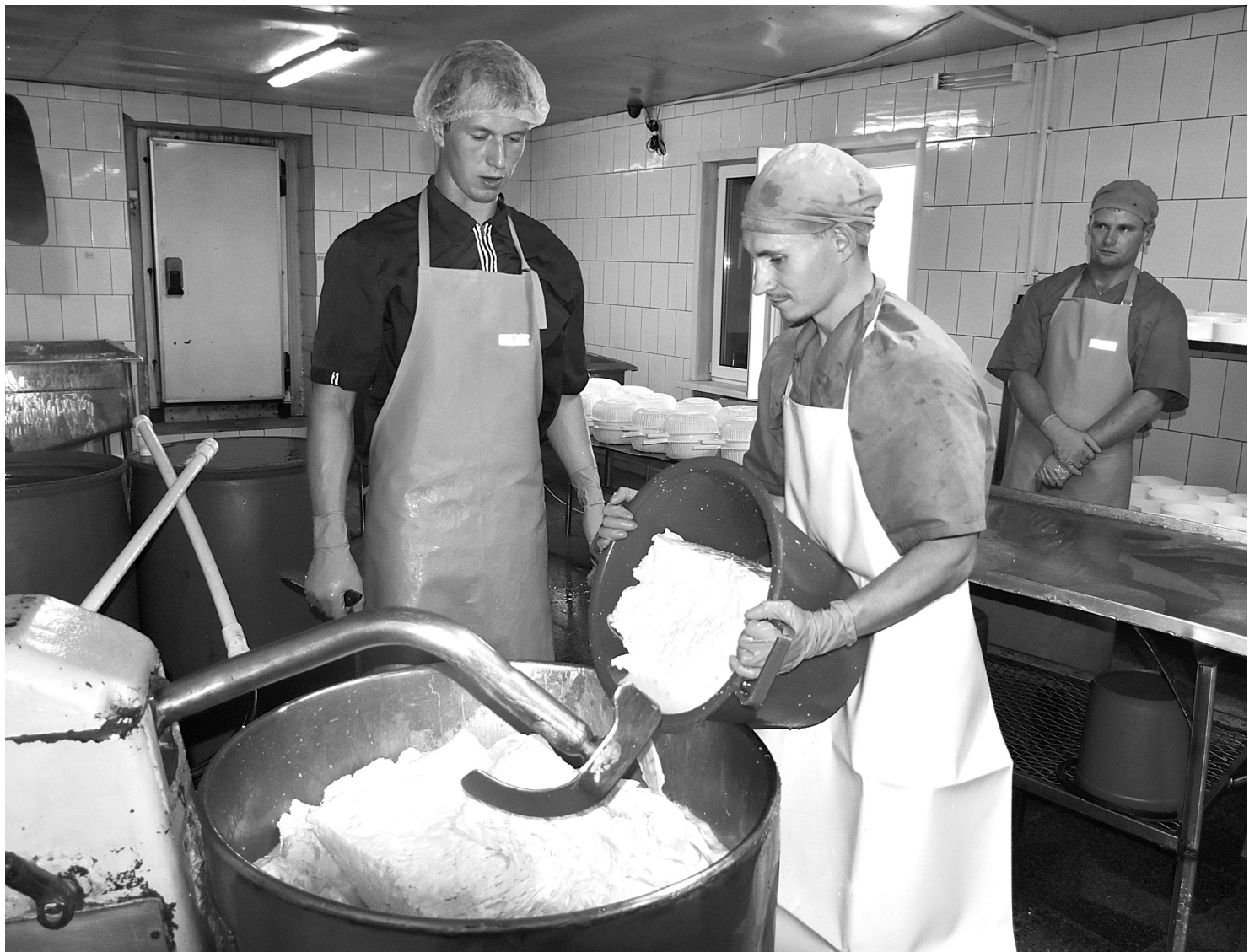
Сыроварня ежедневно перерабатывает до девяти тонн молока. Готовая продукция реализуется в тюменские рестораны

продукция реализуется в рестораны города Тюмени. Там делают хачапури, и самые вкусные получаются только из нашего сыра! Грузинские рестораны сами вышли на нас и стали закупать сыр, со временем покупателей стало больше. «Сулугуни» пользуется особой популярностью в городе.