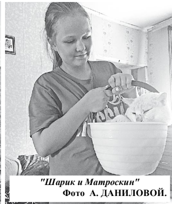
"Шарик и Матроскин"