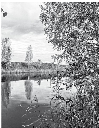
"Прекрасна ты, земля родная" "Озеро - глаза твоей Земли".