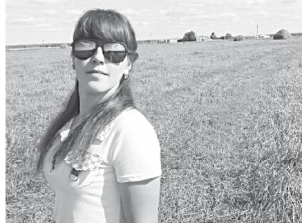
"Люблю тебя, мой край родной".