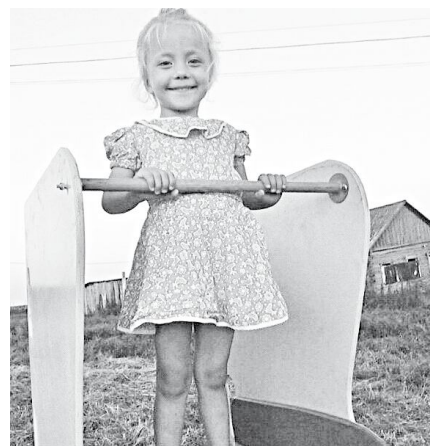
"Очень нравится играть на площадке новой!"