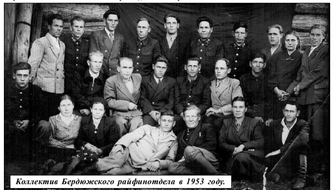
Коллектив Бердюжского райфинотдела в 1953 году.