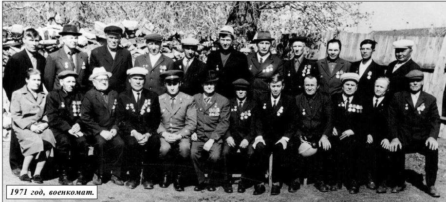
1971 год, военкомат.

Коллектив райфинотдела в 1948 и в 1953 годах вы видите на этих фотографиях. Всех, кто запечатлен на этих снимках, я помню поименно, так же, как и моих коллег по работе в Сберкассе.