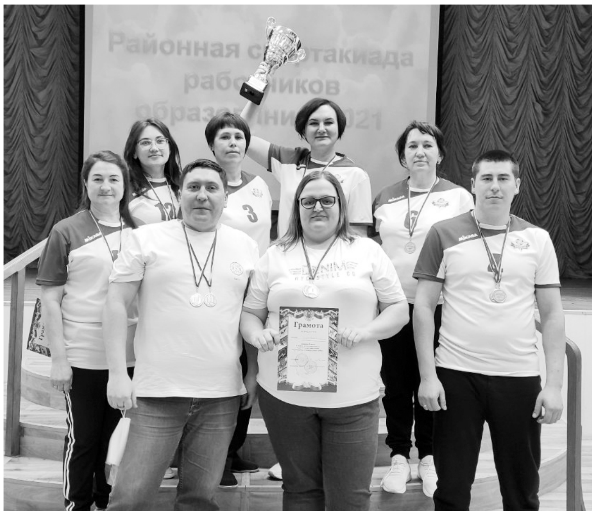
Окуневские педагоги взяли главный кубок соревнований