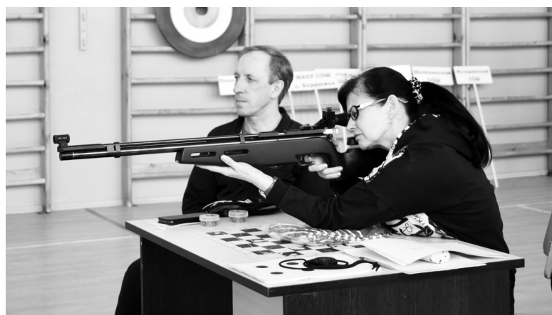
Попадали из пневматической винтовки в цели только самые меткие

В начале апреля педагоги школ района поменяли строгие деловые костюмы на спортивную форму. На базе Бердюжской средней школы прошла спартакиада работников образования, на которую прибыли команды девяти образовательных учреждений района.