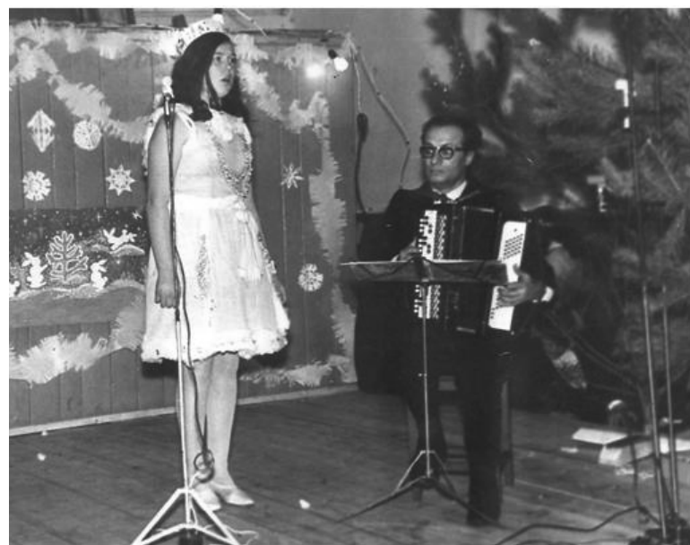
Новогодний утренник, 1970 годы

ственной войны, он всегда вспоминал случай, когда два наших отважных летчика победили в бою восьмерых фашистских ассов. Он в ту же ночь написал об этом песню, которую пела вся вторая эскадрилья 283-го истребительного полка, и за исполнение которой он получил первое место на смотре самодеятельности 13-й воздушной