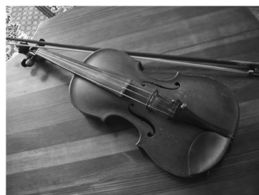
Скрипка, привезенная с фронта, передается по наследству

ственной войны, он всегда вспоминал случай, когда два наших отважных летчика победили в бою восьмерых фашистских ассов. Он в ту же ночь написал об этом песню, которую пела вся вторая эскадрилья 283-го истребительного полка, и за исполнение которой он получил первое место на смотре самодеятельности 13-й воздушной