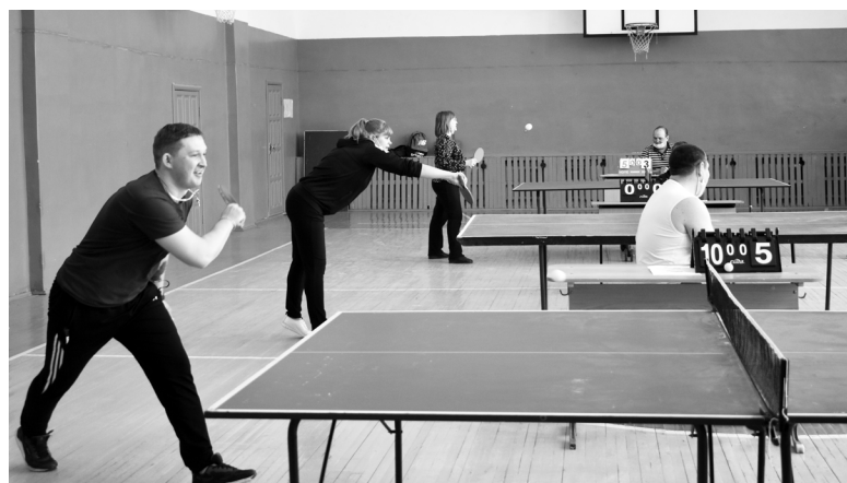
В настольном теннисе игры проходили на нескольких столах. Шла упорная борьба за каждое очко