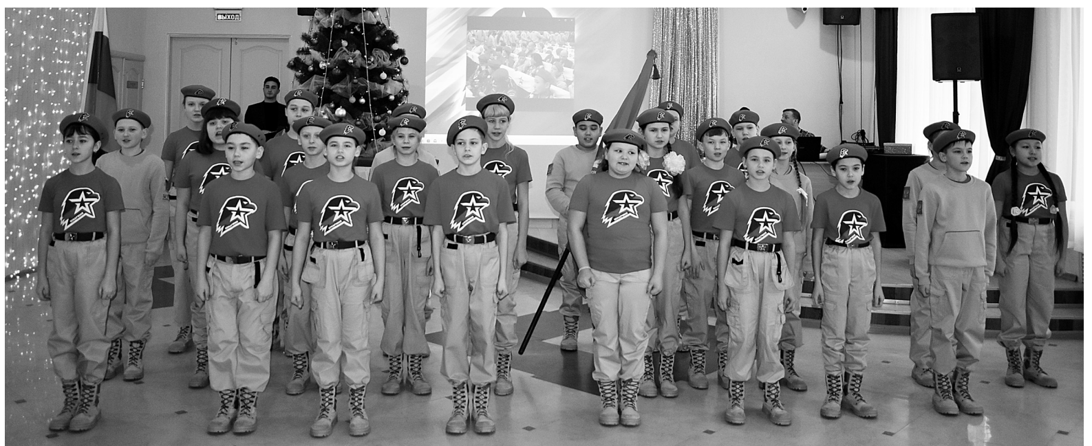
Бердюжский отряд «Орленок» приветствует новых участников юношеского движения

– В этом году добровольному детско-юношескому движению «Юнармия» исполнилось пять лет. За эти годы в его ряды вступили сотни тысяч детей, – отме-