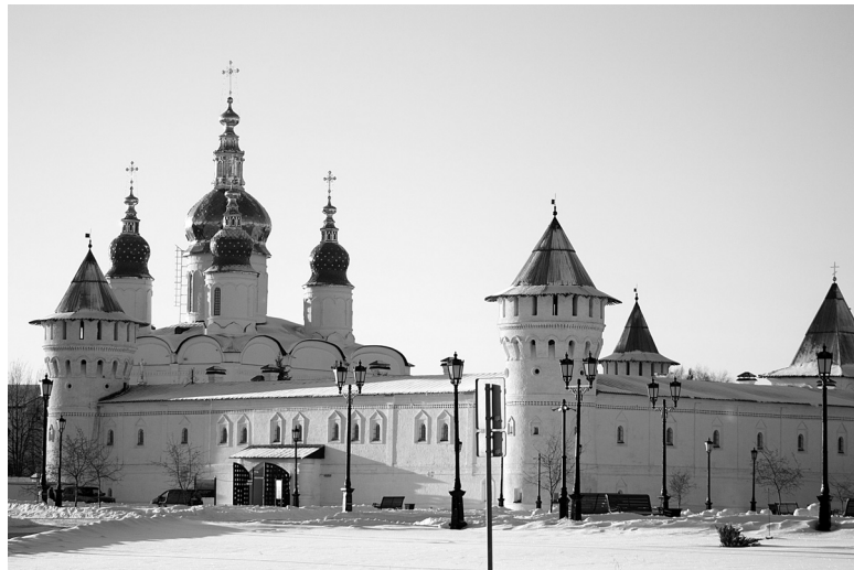
Прогулка по зимнему городу приносит новые впечатления и эмоции

Тобольский Кремль называют маленьким чудом земли Сибирской. Он хранит множество тайн и загадок. Есть предания о подземных ходах, о спрятанных в смутное время сокровищах епископа Гермогена, о привиде-