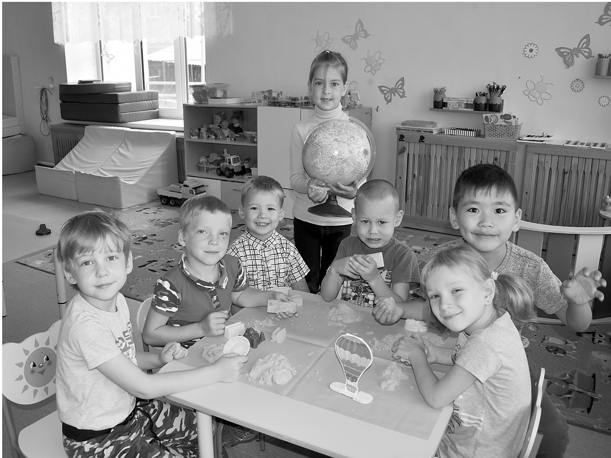
Ребятам некогда скучать – на занятиях они играют, лепят и познают окружающий мир