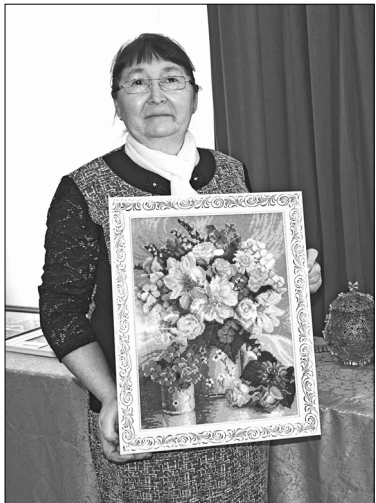
В коллекции Инзиры Слинкиной - картина, выполненная в технике алмазной живописи