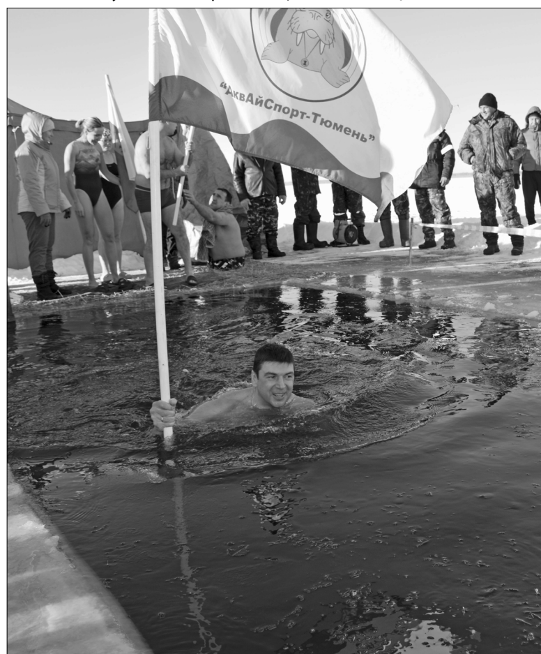
С улыбкой спускались в прорубь уктузского озера тюменские «моржи»

– Душа поет, когда клюет! – сказал в заключение нашей короткой беседы один из моих собеседников. И, думаю, с его мнением согласились бы все участники соревнований.