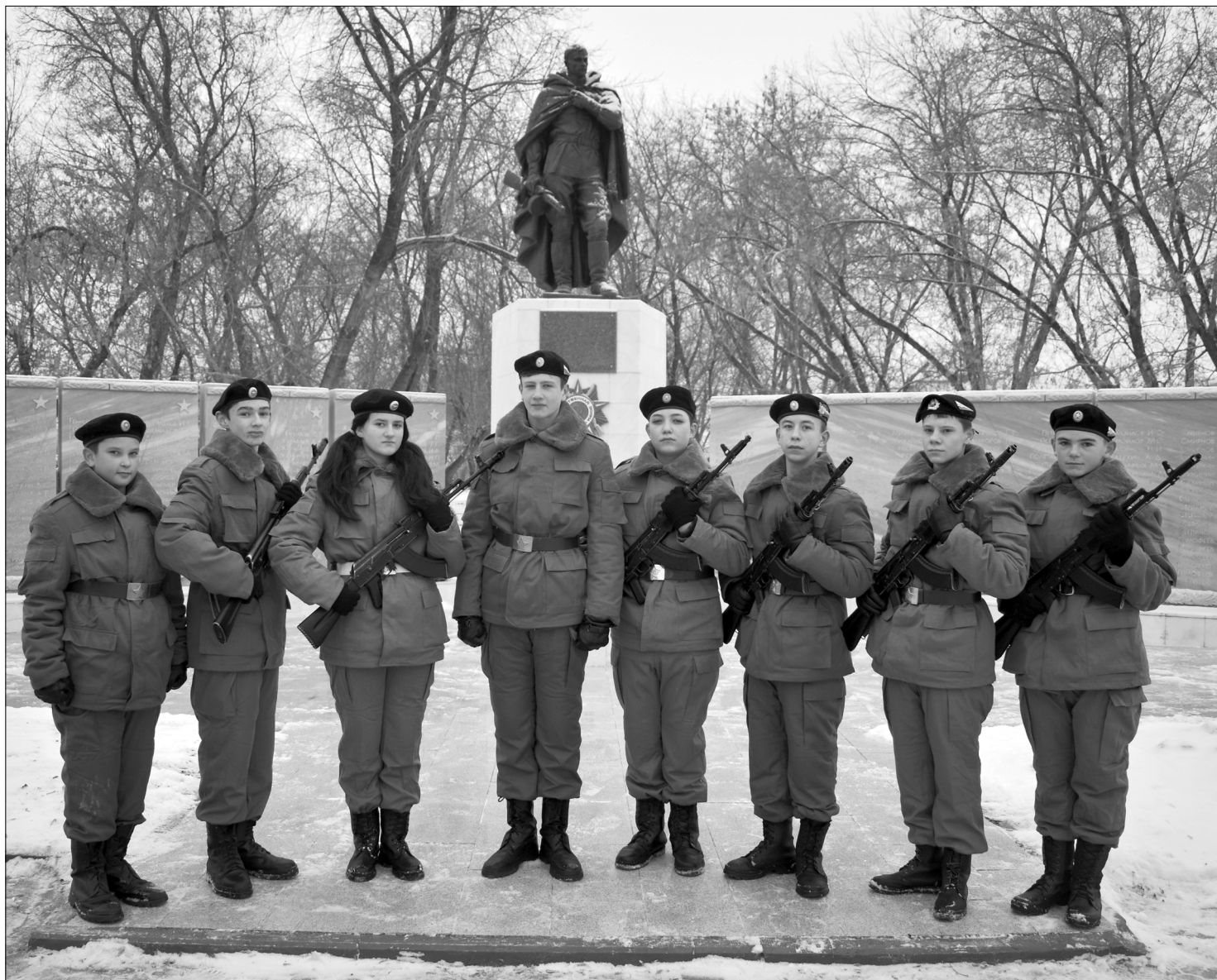
Воспитанники кадетского класса «Стрижи» - участники всех патриотических мероприятий в районе