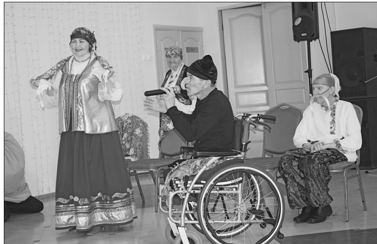
Выступают самодеятельные артисты из Истошинского дома-интерната