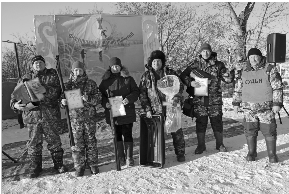
Дипломы и ценные подарки получили и опытные мастера подледного лова, и начинающие рыбаки

30 ноября Уктуз принимал участников и многочисленных гостей фестиваля по подледному лову «Народная рыбалка – 2019». Это было завершающее мероприятие, которое проходило в нашем районе в рамках празднования 75-летнего юбилея Тюменской области.