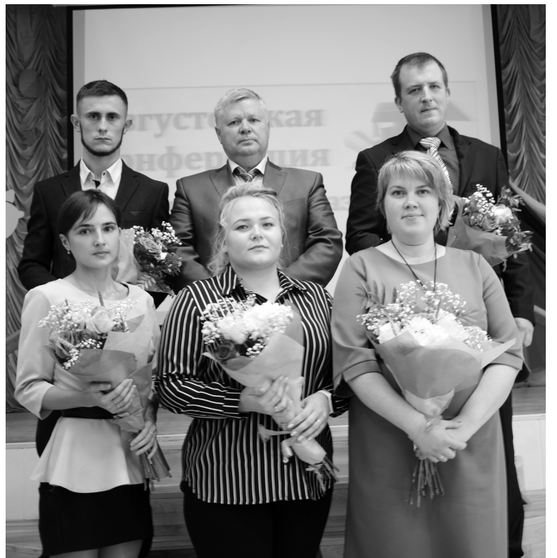
Молодые специалисты пополнили ряды педагогов нашего района