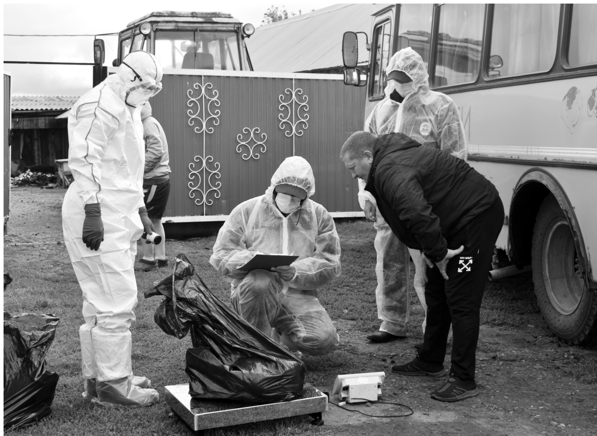
Противозооотический отряд провел работу по отчуждению птицы в Бердюжье и Гагарина

Ветеринарные работники напоминают, грипп птиц – заразное заболевание, вызываемое вирусом. Благодаря высокой способности к изменению вируса, гриппом птиц болеют домашняя и дикая птица, многие виды животных и человек. Домашняя птица заражается от дикой, водоплавающей птицы (которая переболевает в основном бессимптомно, но длительное время может быть носителем вируса) или птицы, живущей рядом с человеком