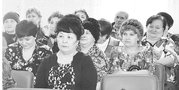
Люди пришли на сход с тем, что их волновало, — ремонт дорог, медицинское обслуживание, порядок на улицах...