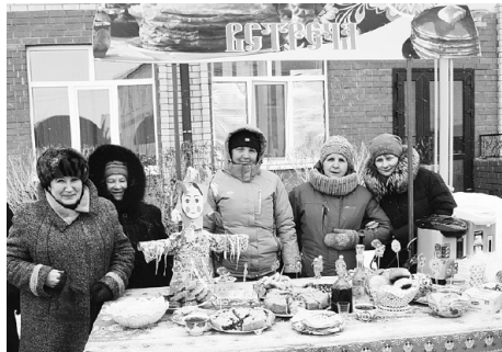
На Масленице каждый мог полакомиться блинами.

ленной неделе» ребяташки и взрослые могли попробовать угощений на любой вкус – пирогов, блинов с разными начинками, выпить горячего чая и, конечно, принять участие в народных забавах. Напри-