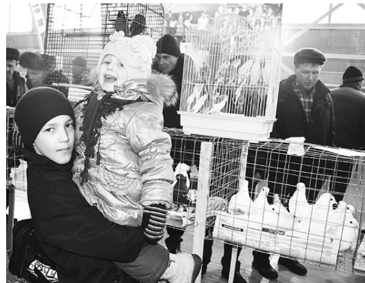
Птицы приносят детям радость.

группы: те, у кого птиц поменьше, приехали сегодня в Бердзюжку, а остальные отправились на выставку в Новосибирск. С бердзюжскими голубеводами общаемся по телефону и в социальных сетях. У наших стран всегда были дружеские отношения. Голуби сблизжают людей разных возрастов и национальностей. Мне уже 72 года, а общаюсь с молодежью на равных. Голуби появились у меня в 60-х годах. В послевоенное время, после голода и разру-