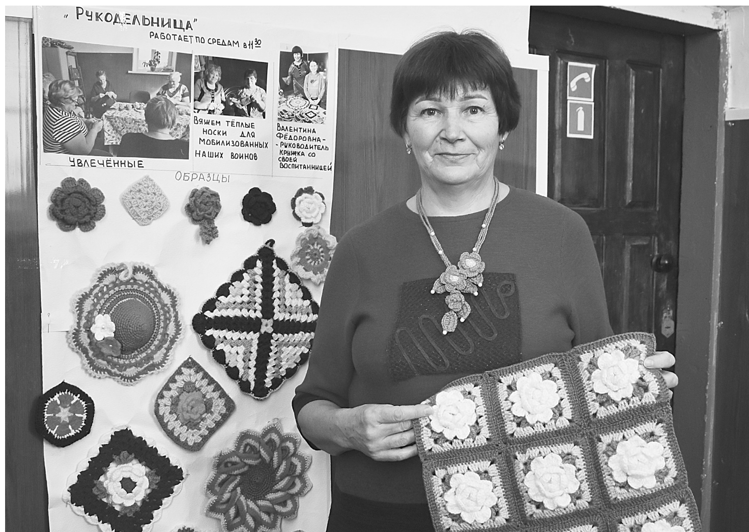
Мастерица увлекается вязанием больше 50 лет и теперь учит рукоделию женщин