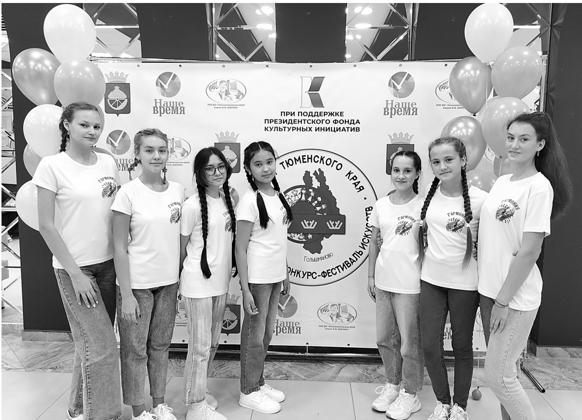
Вокальная группа «Гармония» награждена дипломом лауреатов первой степени по итогам областного конкурса-фестиваля искусств «Таланты Тюменского края»