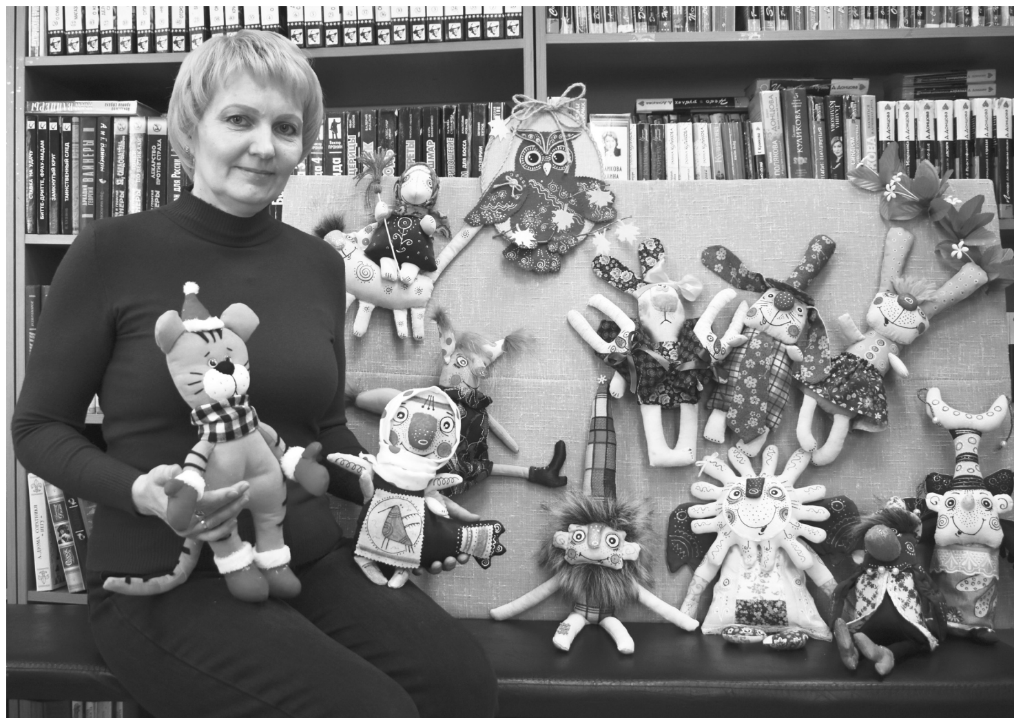
Елена учит шить таких замечательных кукол мастериц студии