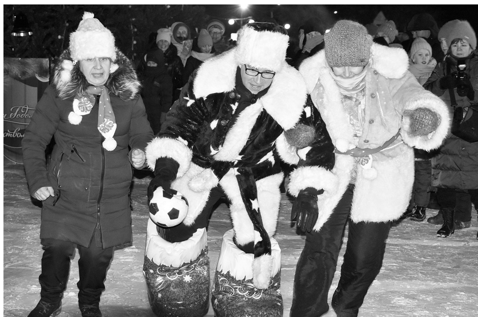
Веселые конкурсы «Морозной олимпиады» вызвали в рядах зрителей хохот

Под веселые, задорные песни начался праздник. Оригинальные конкурсы «Морозной олимпиады» стали сюрпризами для его участников, ведь они даже и не догадывались, какие испытания их ждут.