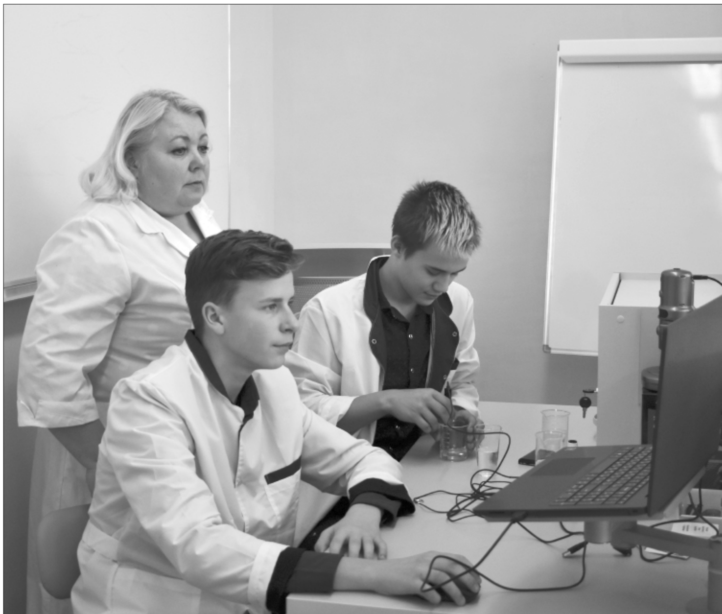
На уроках химии у ребят продолжают практические занятия и опыты