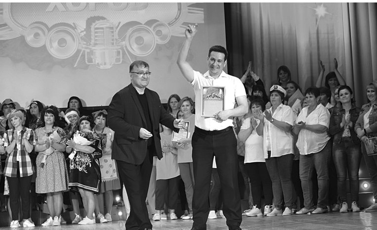
Приз зрительских симпатий достался Бердюжской школе

Давно районный Дом культуры не принимал столько зрителей, как в один из июньских дней. Здесь проходил VI районный фестиваль-конкурс самодеятельного творчества «Битва хоров». Тема фестиваля – «Старые песни о главном».