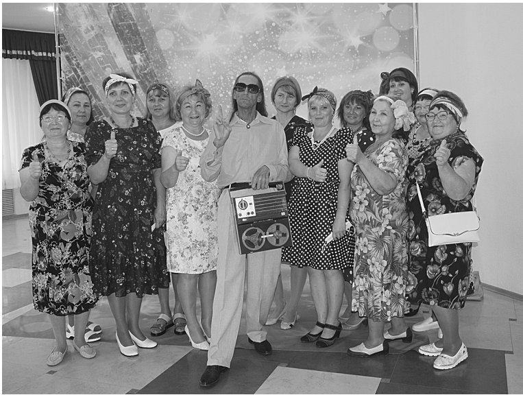
Окуневцы, как всегда, на высоте