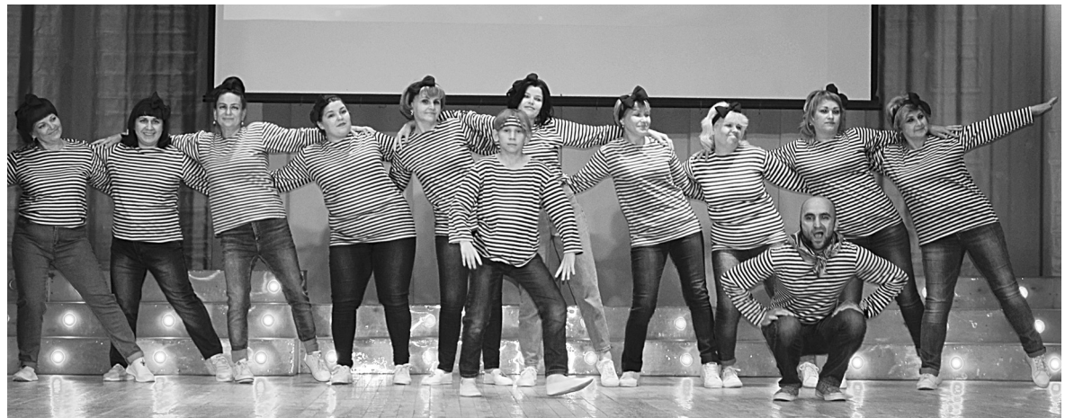
Хор районной больницы - лучший!