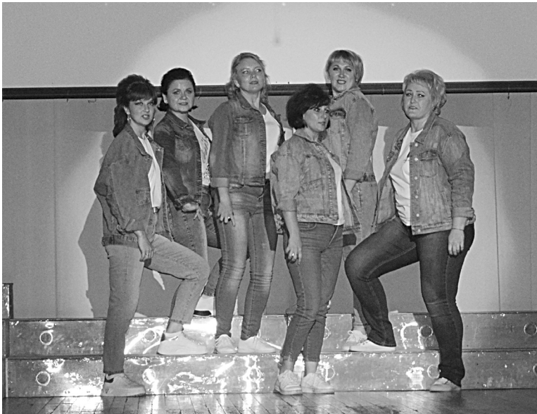
На сцене - родители воспитанников «Розового букета»