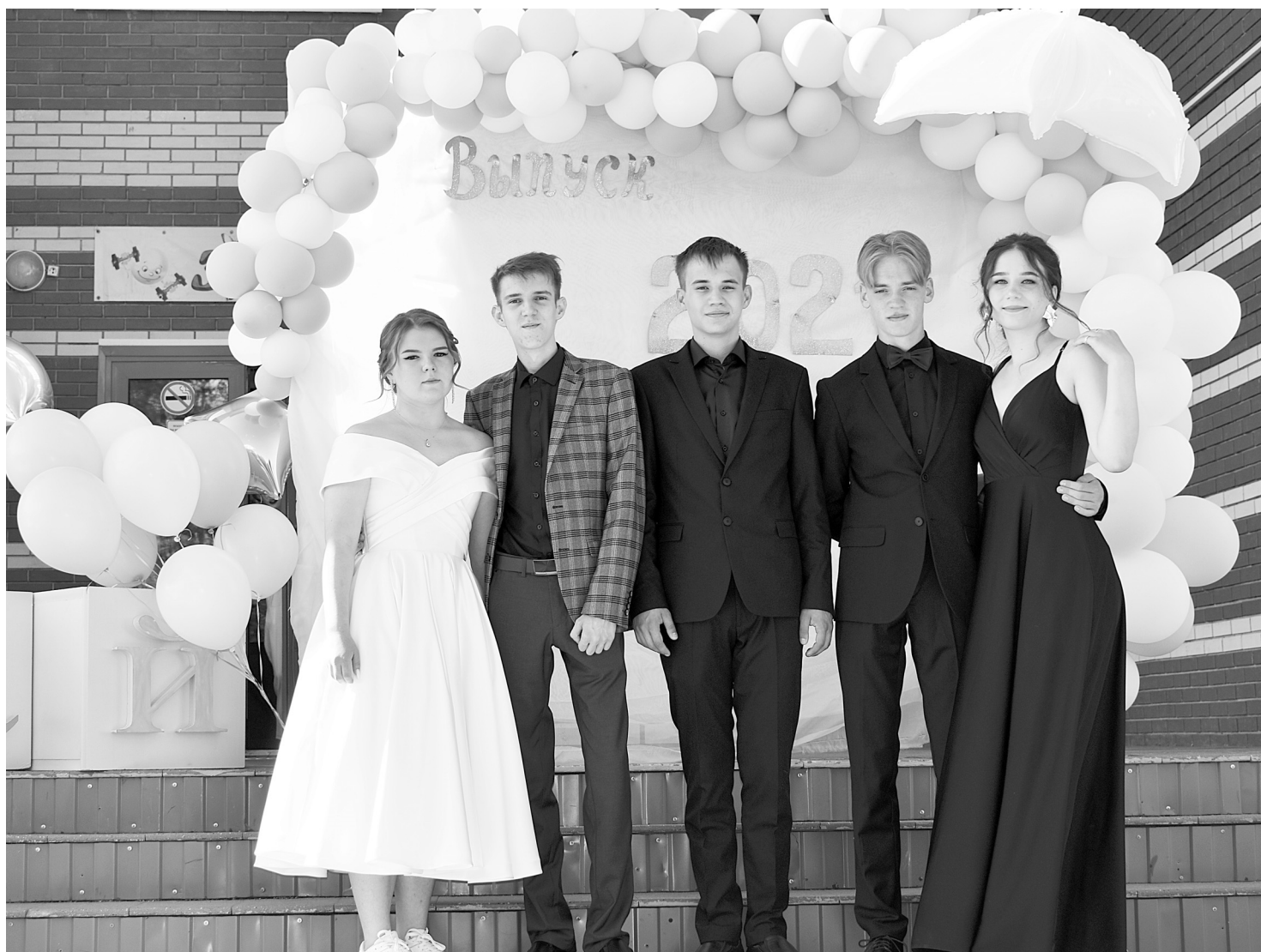
Красивые и счастливые, выпускники улыбаются друг другу и радовались окончанию напряженной поры экзаменов