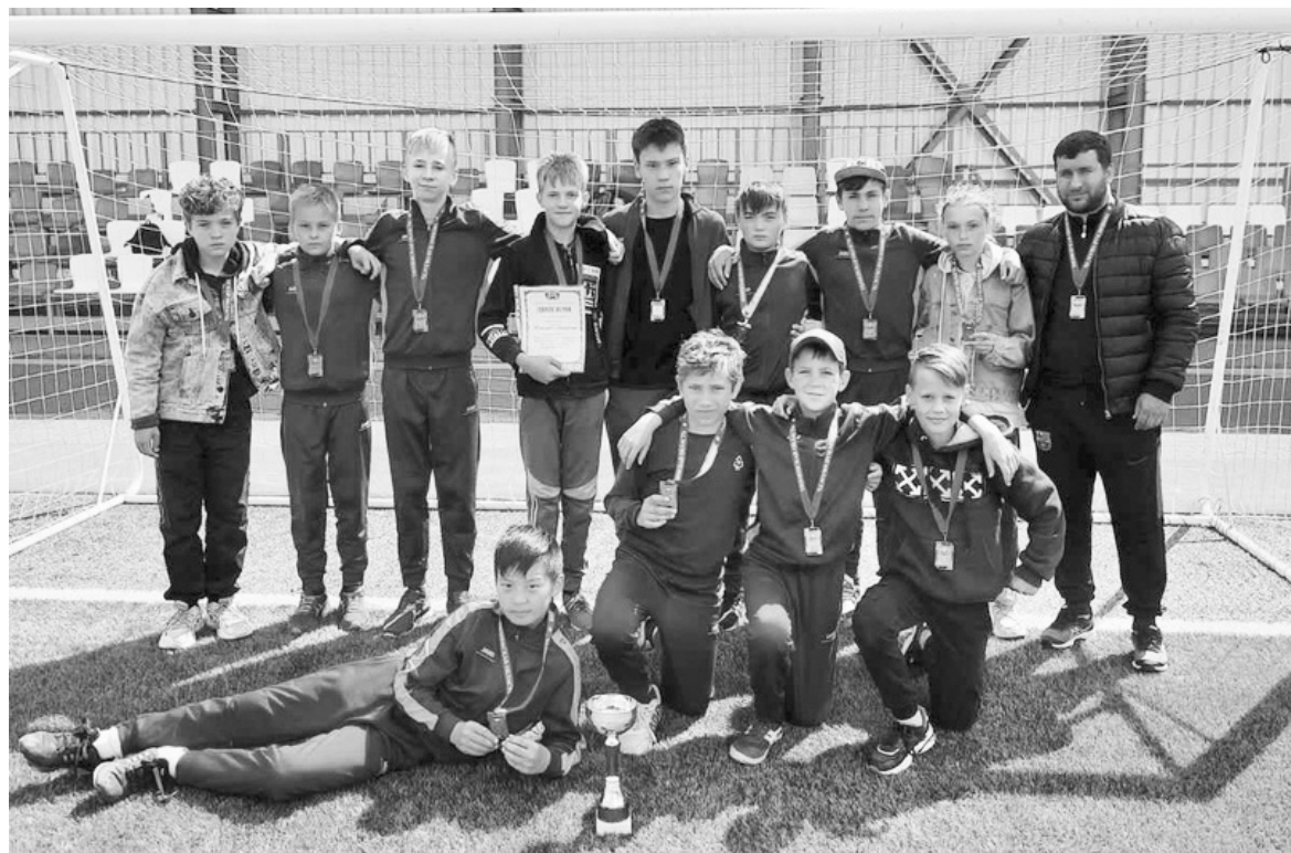
Команда «Водник» - неоднократный победитель межрайонных и областных соревнований