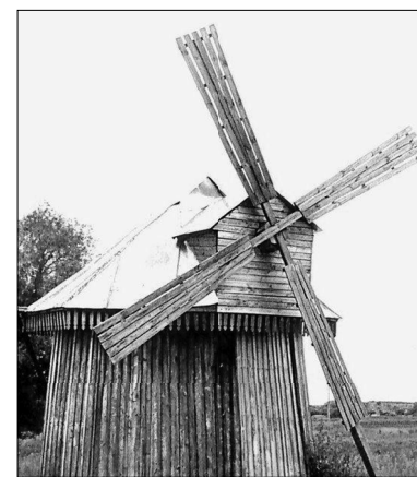
Ветряная мельница (ветрянка)