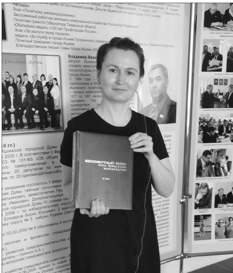
В книге собраны архивные материалы и фотографии 100 журналистов-фронтовиков