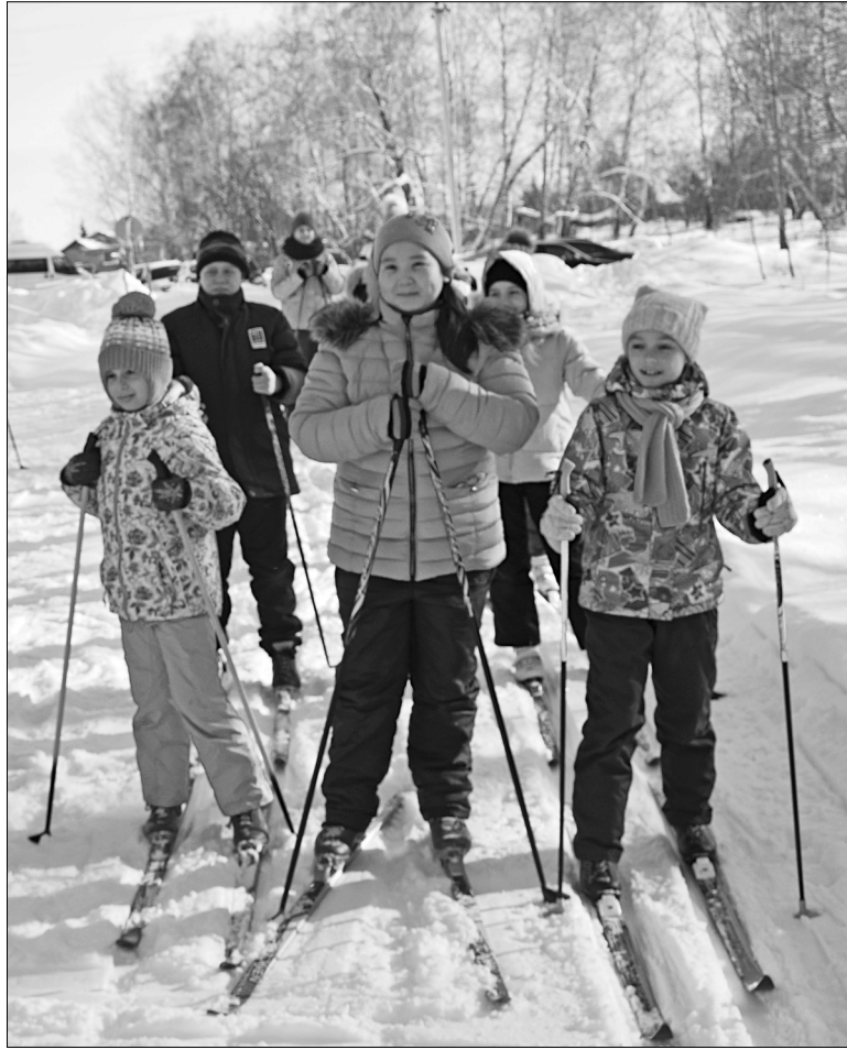
На лыжах любят кататься ребята разных возрастов

– Наша главная задача – не достижение показателей, цифр, а создание условий для развития спорта. В прошлом году 3085 человек из числа детей и молодежи систематически занимались физкультурой и спортом. В нашем районе создано несколько спортивных секций, достаточно тренеров, преподавателей, инструкторов, которые занимаются с детьми по графику. Для привлечения к занятиям спортом детей и молодежи планируется совместно с образовательными учреждениями района проводить просмотры художественных фильмов о великих спортсменах с последующим обсуждением и обменом мнениями. Ежегодно будут проводить семинары совместно с методистами по