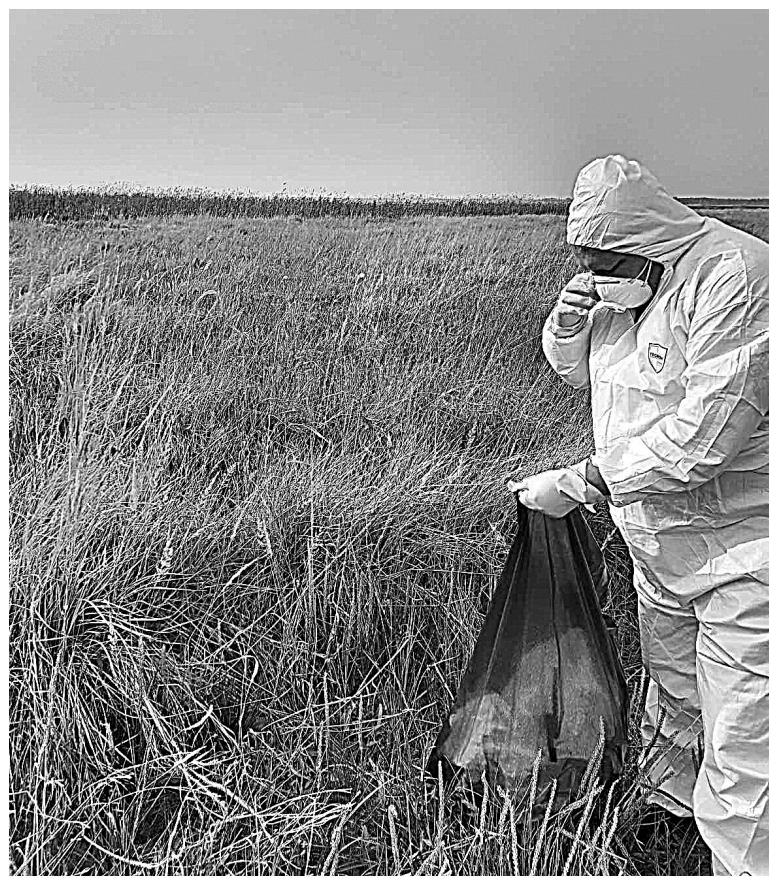
Всех обнаруженных особей пеликана собрали и утилизировали путем сжигания

Для профилактики заражения гриппом птиц жителям Тюменской области рекомендуют