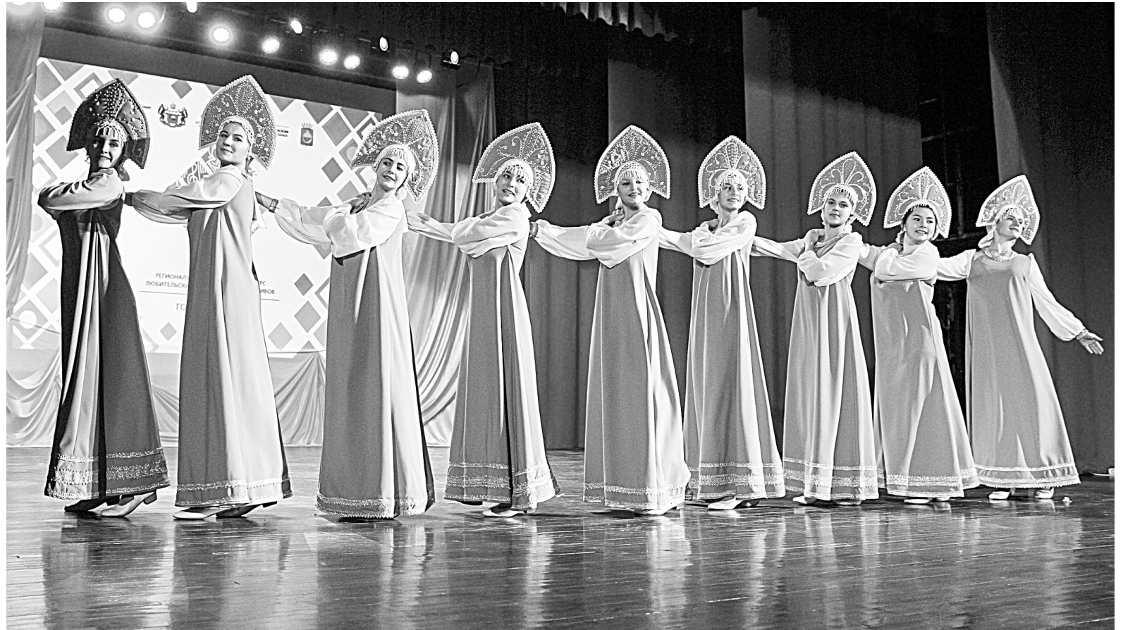
Хореографическая студия «Розовый букет» стала дипломантом регионального фестиваля

В период карантина и отмены массовых мероприятий работникам Домов культуры пришлось активно осваивать различные интернет-площадки, участвовать в онлайн-акциях, проводить концерты во дворах и социальных сетях.