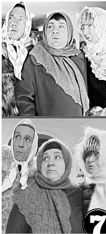
Окуневцы сделали свой снимок по мотивам фильма «Джентельмены удачи»