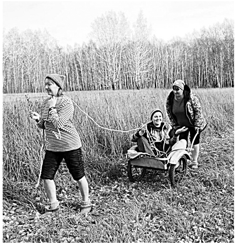
Участники онлайн-фестиваля «Стоп! Снято!» из Пеганово представили кадр из фильма «Самогонщики»