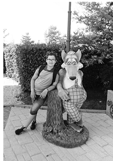
Ну чем мы не пара?