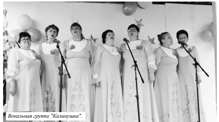
Вокальная группа "Калинушка".