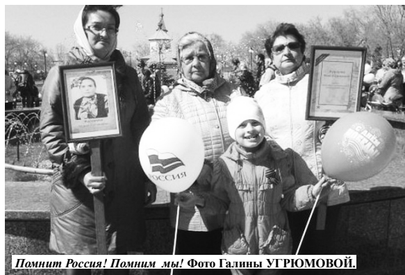
Помнит Россия! Помним мы!