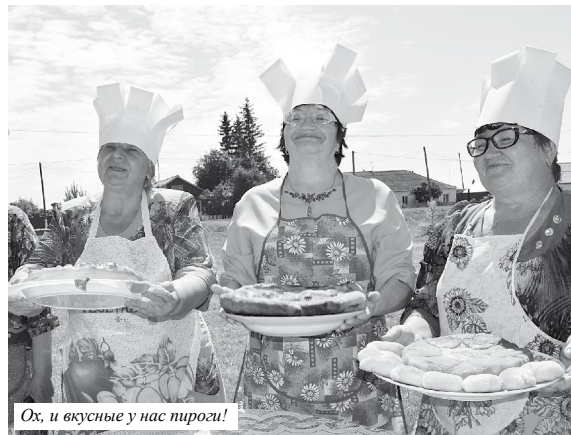
Ох, и вкусные у нас пироги!