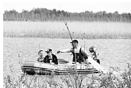
Мы на лодочке катались, родной природой любовались!