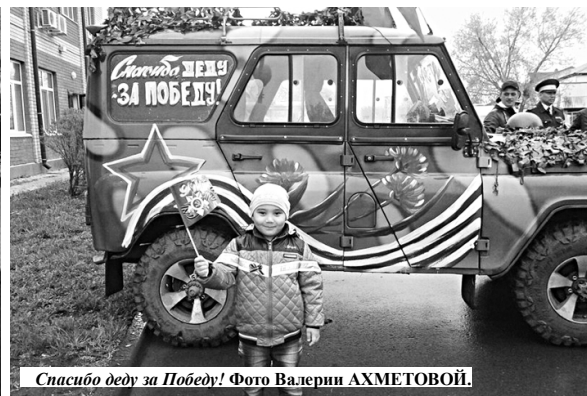
Спасибо деду за Победу!