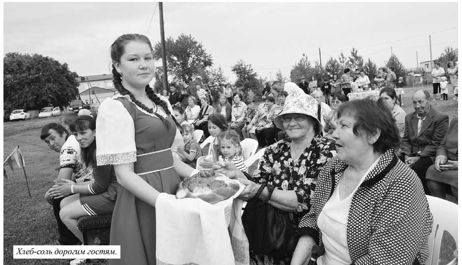
Хлеб-соль дорогим гостям.