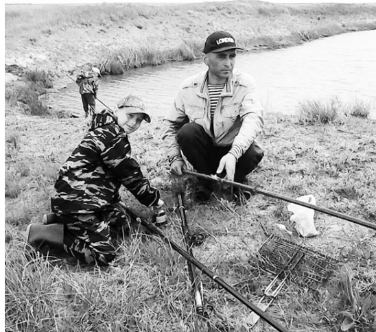
Рыбалка - дело хорошее.