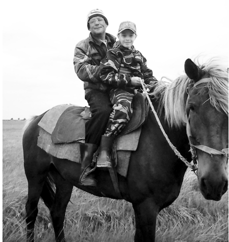
Мы на лошади вдвоем.