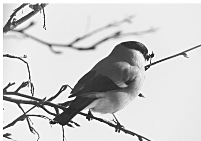
На веточке рябины, как красный огонек, Сидит снегирь веселый, расправив хохолок.