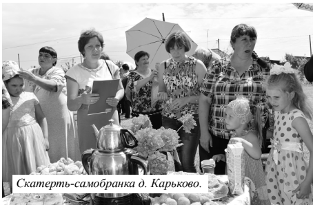
Скатерть-самобранка д. Карьково.