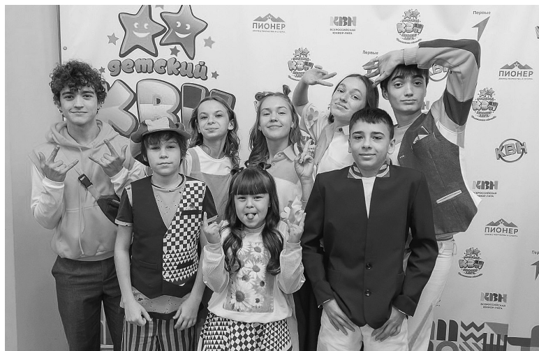
Команда «Дети РайЦентра» в обновленном составе начала сезон

В новом сезоне у бердюжской команды обновленный состав. Некоторые ребята пока взяли паузу – из-за учебы и подготовки к выпускным экзаменам,