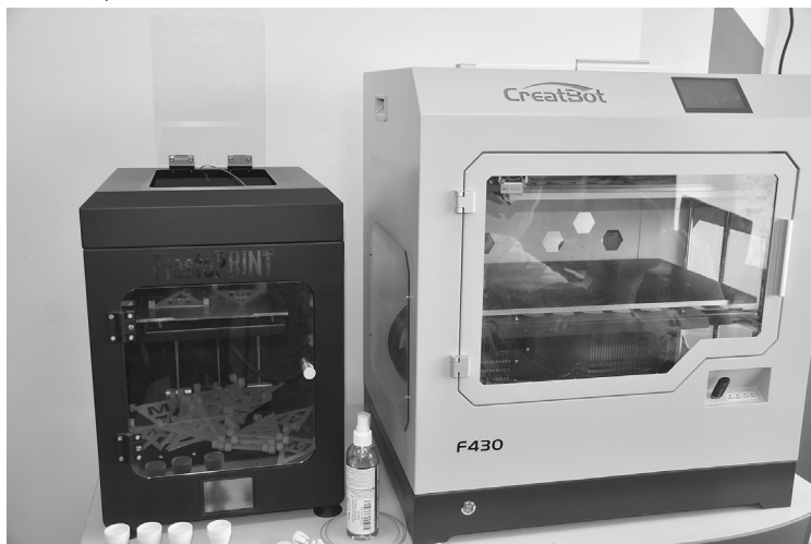
На 3D-принтерах ребята создают детали для своих моделей