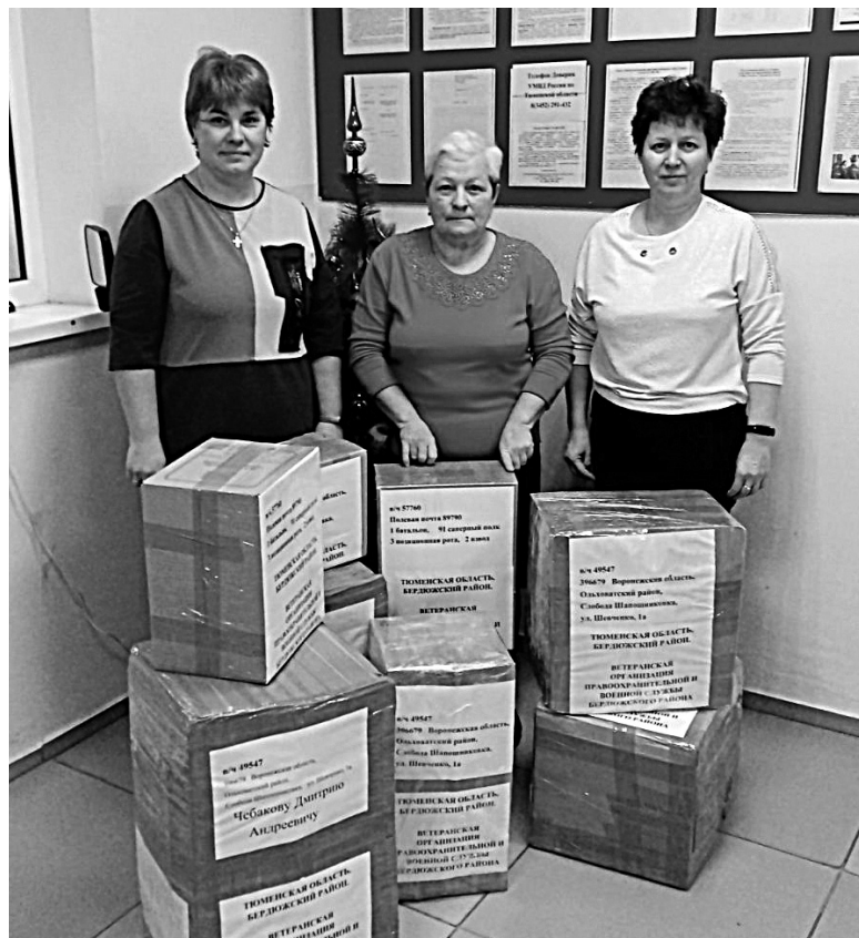
Женщины укомплектовали и отправили десять посылок