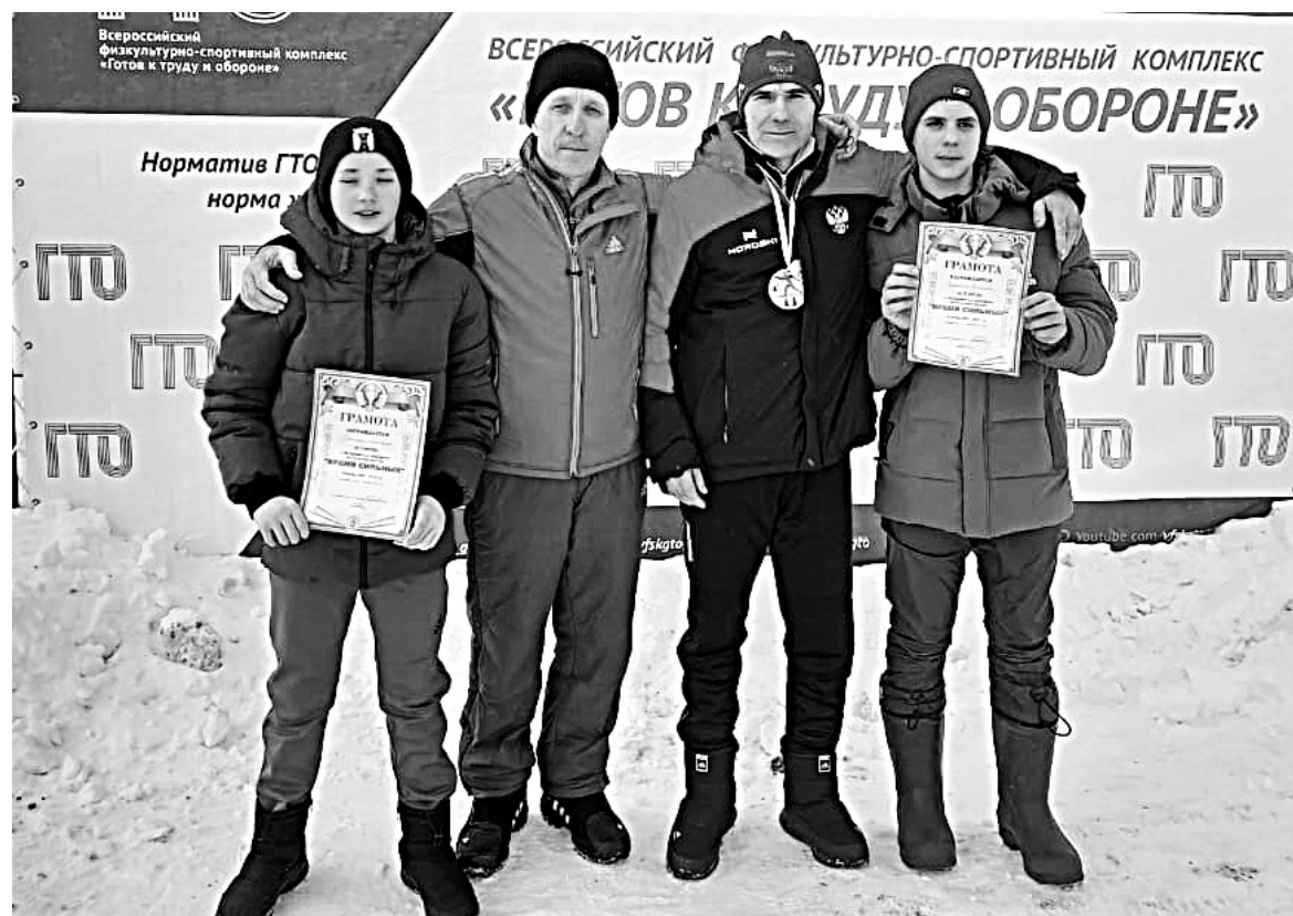
С грамотами и медалями вернулись наши спортсмены с марафона «Время сильных»

Юлия МИХАЙЛОВА