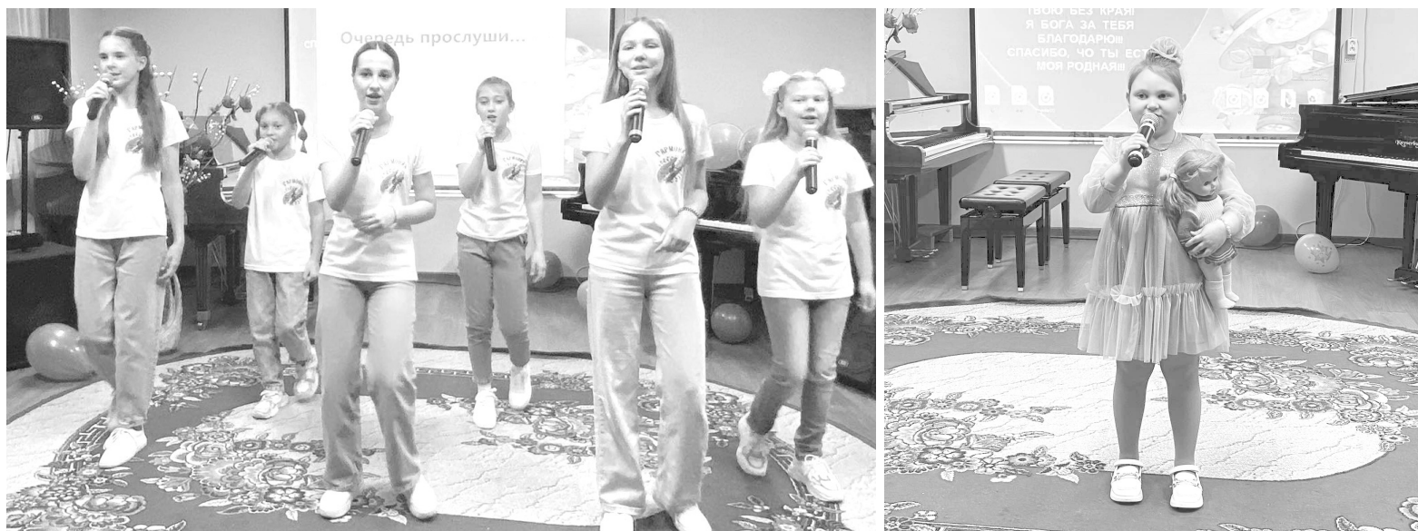
Лучшие музыкальные и творческие номера прозвучали в этот вечер для наших дорогих и любимых мам

Юлия МИХАЙЛОВА