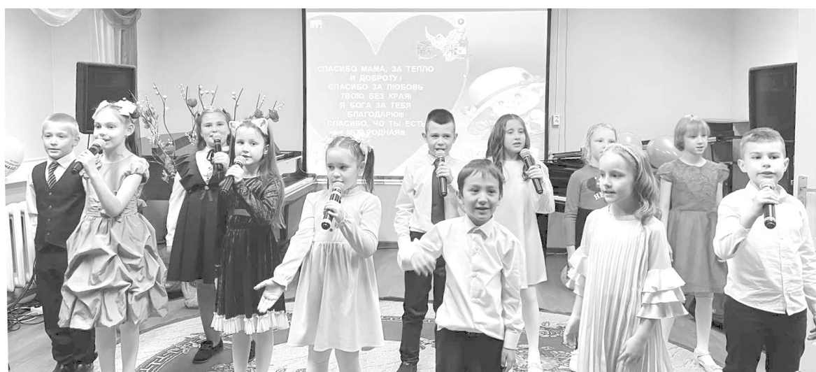
Младший хор детской школы искусств «Гармония» открывал праздничный концерт

Они читали стихи, поздравления для мам и объявляли сле-