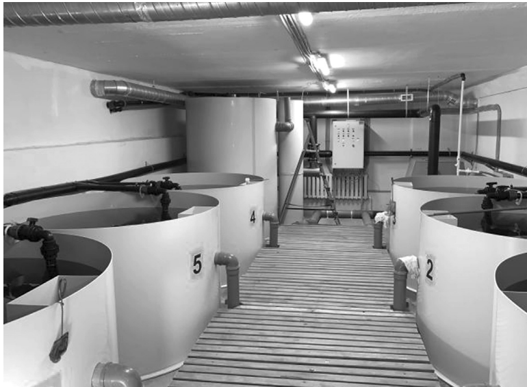
«Рыбное подворье» – автоматизированная современная ферма с цехом водоподготовки. Вода проходит шесть ступеней очистки перед подачей в бассейн

Живем мы не в южных краях, поэтому рыба осетровых пород для жителей Сибири – желанный деликатес. Предприниматели из села Червишево решили создать свою акваферму.