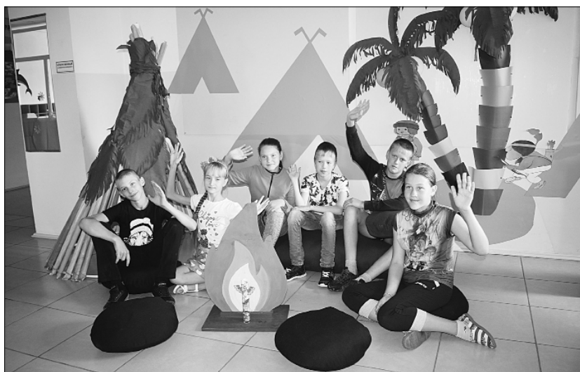
Каждый день дети собираются у «костра» и делятся новостями.