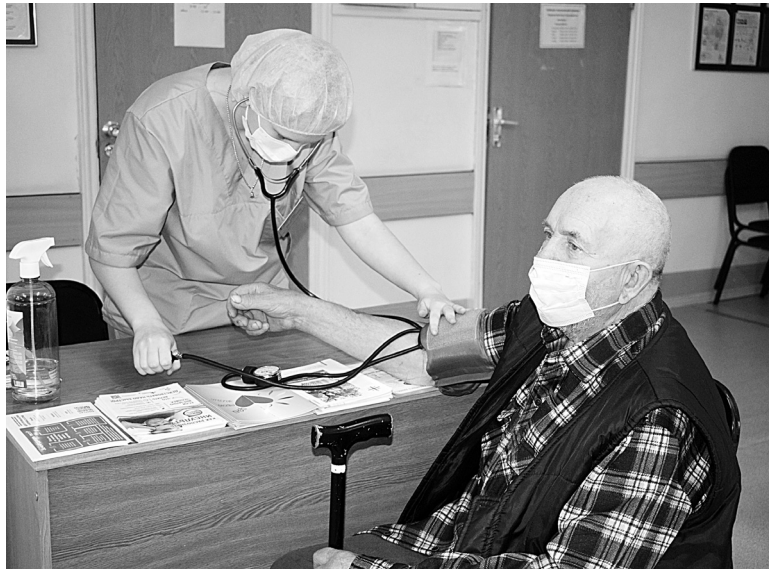
На занятиях пациенты могут узнать о профилактике заболеваний и оказании первой помощи

Тема «Особенности двигательной активности людей пожилого возраста» затронула всех присутствующих. Специ-