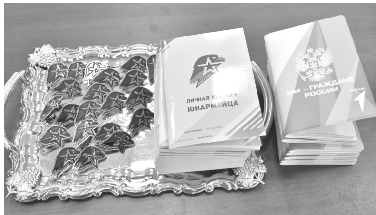
Для каждого юнармейца – личная книжка и значок

ского класса «Стрижи» под звуки гимна Российской Федерации внесли флаг нашей страны. Ученики школ, юнармейцы почтили минутой молчания память земляков, павших в годы Великой Отечественной войны, и всех героев, сражавшихся за нашу Родину.