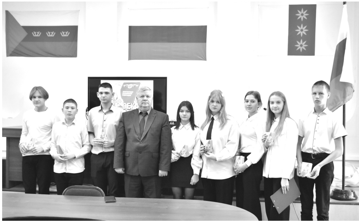
Восемь юношей и девушек получили главный документ в их жизни - паспорт

В Бердюжском районе в юнармейском движении насчитыва-