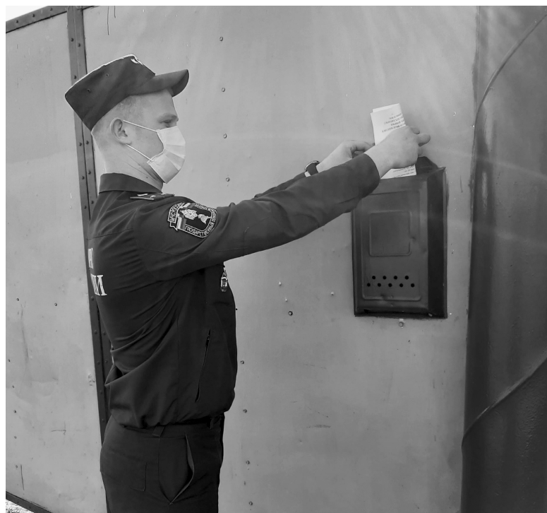
Теперь пожарные оставляют памятки в почтовых ящиках

Ольга ЛЕЩЕВА