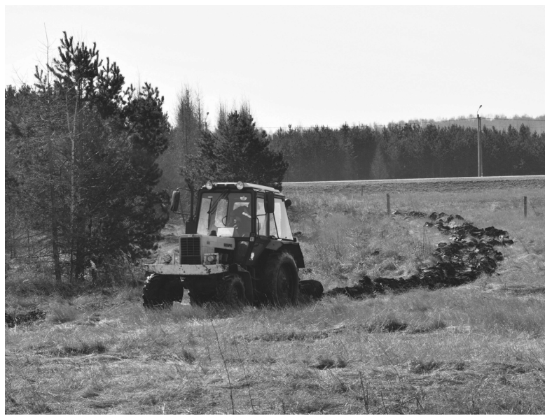
Опашка хвойных массивов уберезет лес от пожаров

Ежегодно для обеспечения пожарной безопасности и усиления охраны лесов от пожаров в стране устанавливается пожароопасный период. В тюменской области он объявлен с 10 апреля этого года.