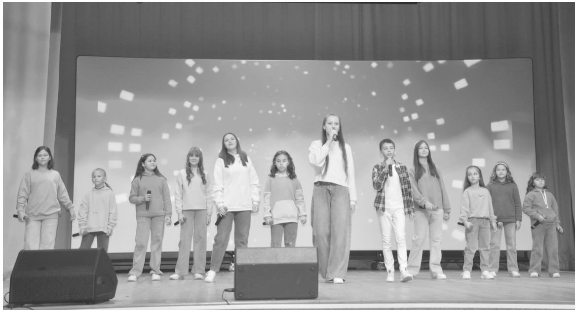
Юные вокалистки студий районного Дома культуры подарили зрителям любимые песни

В оргкомитет фестиваля поступило 67 заявок от юных вокалистов, художников и мастеров декоративно-прикладного искусства в возрасте от 5 до 18 лет. В течение нескольких месяцев участники готовились к фестивалю – разучивали новые песни, придумывали наряды, репетировали. За кулисами, перед началом выступлений